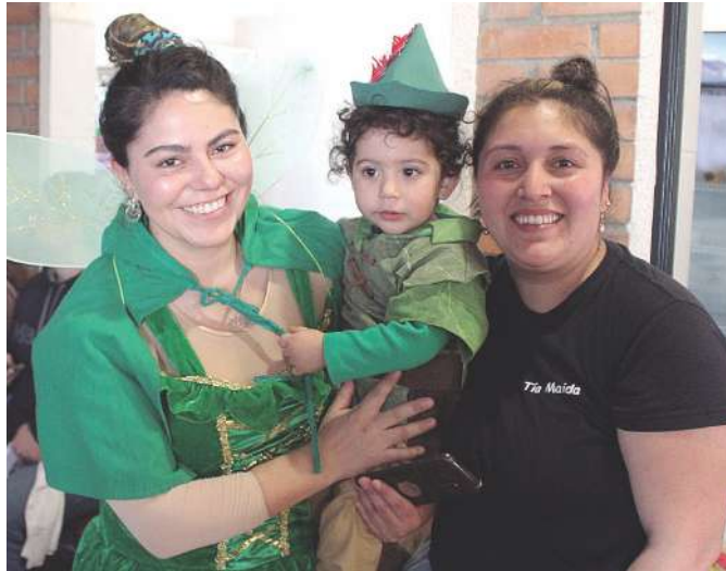
La actividad estuvo marcada por los entretes disfraces con que desfilaron los niños y sus padres.