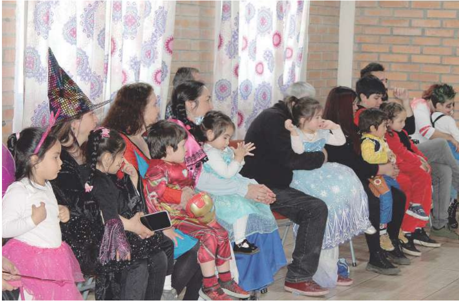
“Entrete” desfile ayer de niños y niñas y sus padres disfrazados