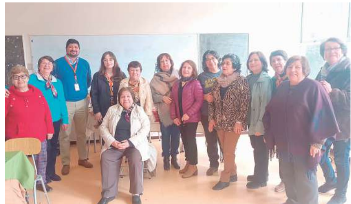
Las integrantes del taller de bordado y tejido "Concepción Martínez".