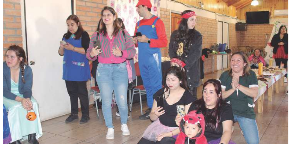
El jardín fue fundado un 10 de octubre de 2010.

Estrellitas del Rosario y sus padres lucieron lúdicos disfraces, este centro educativo celebró ayer 13 años sirviendo a la comunidad.