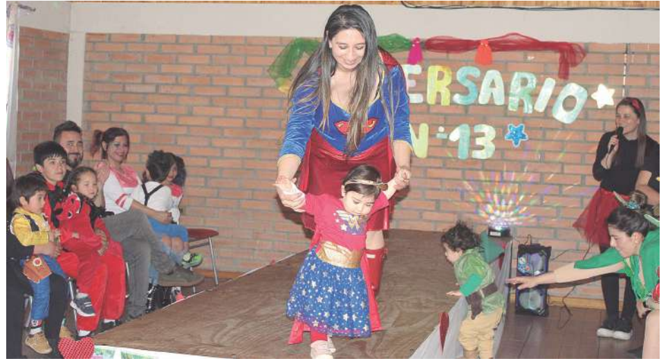
Estrellitas del Rosario celebró 13 años como centro educativo preescolar.