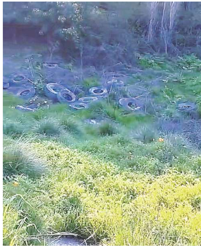
Existe preocupación por rellenos con escombros de la ribera del río Picoiquén.

cuando llueva, donde generalmente estos cauces tienden a recuperar los espacios que el hombre les ha ido ocupando. "Se trata de rellenos inestables, sobre los cuales se construye, y que va afectado el lecho del río, generando menos espacios para la biodiversidad, cortando los