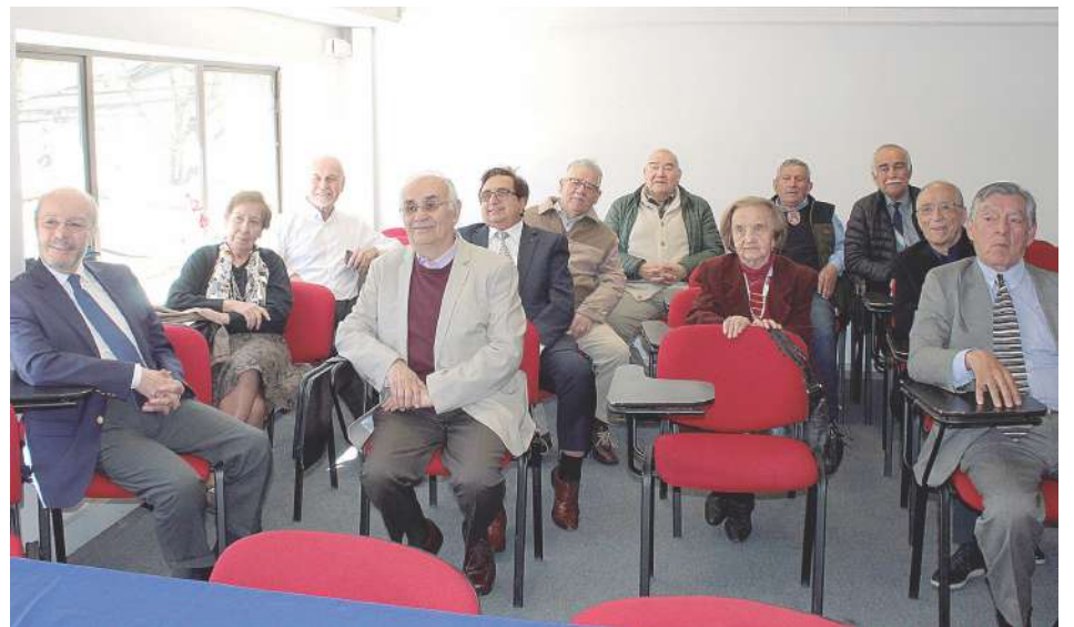
Los asistentes al encuentro de la Generación del 68 del Liceo de Hombres de Angol.