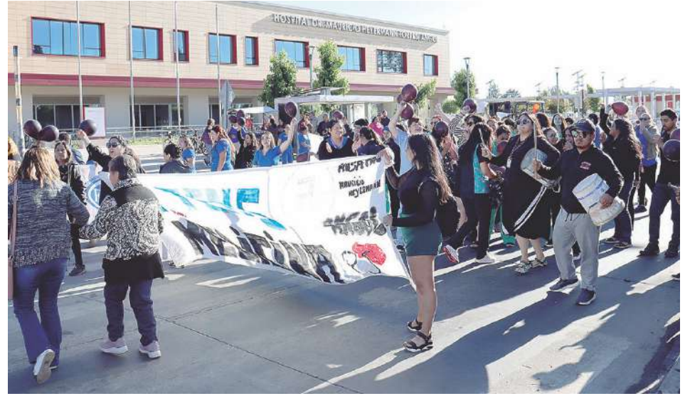
La movilización efectuada ayer en la mañana en el frontis del Hospital de Angol.

laboral hacia la enfermera coordinadora de Medicina, lo que se produciría porque ella ha estado solicitando soluciones.