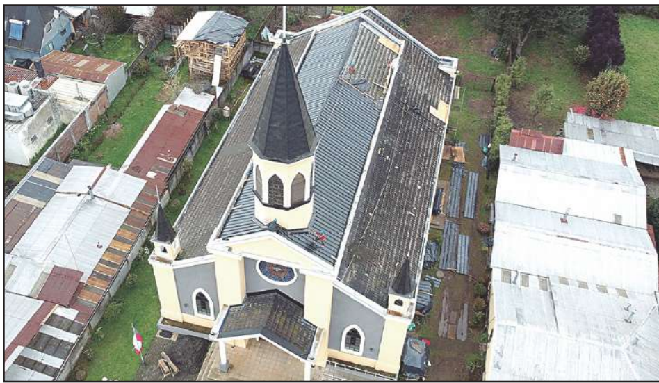
Se efectuaron labores al interior y exterior del templo parroquial.

Los trabajos incluyeron labores en el interior de la parroquia, donde se repararon muros y cielos afectados por