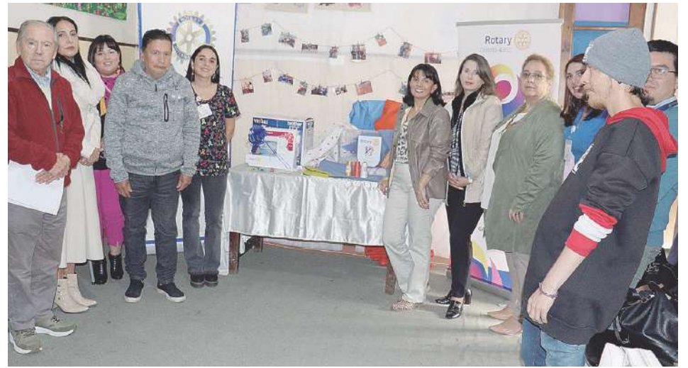
Las personas presentes en la actividad en que Rotary Club Angol Esperanza efectuó la donación al Hospital de Día.

“Así nació este proyecto de la entrega de esta máquina de coser, que en el fondo