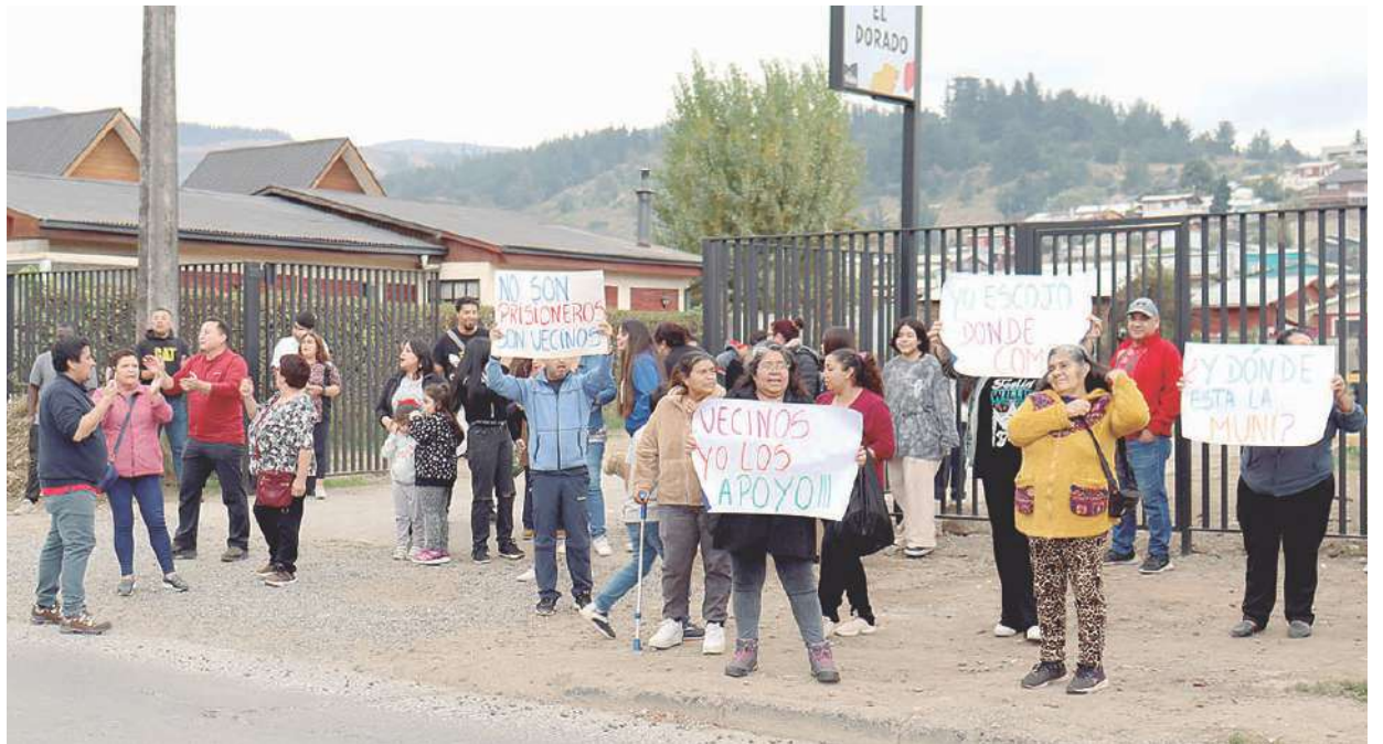
Manifestaciones en favor de las cuatro familias afectadas hubo en los últimos días, en la calle Colima, donde el terreno que fue usado como calle fue cerrado por su dueño.