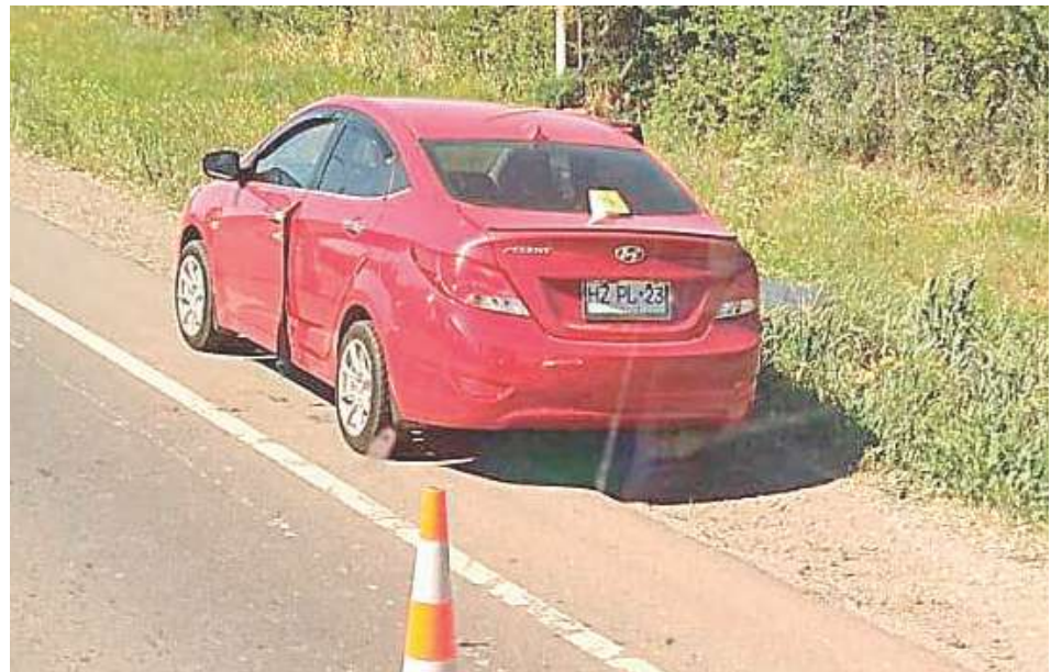
El vehículo en que fue agredida mortalmente la víctima, en el cruce de Coihue, comuna de Negrete.

En la audiencia del martes no estuvo el condenado, ya que está en calidad de prófugo desde el día 25 de junio pasado, un día después de que terminara el juicio en su contra y fuera hallado culpable, cuando comenzó a incumplir la medida cautelar de arresto domiciliario total en que estaba en su casa, en la comuna de Negrete.