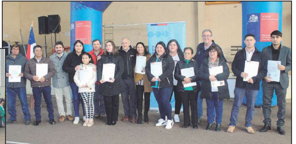
Los vecinos y vecinas del Parque Las Rocas I recibieron felices las escrituras de sus casas y departamentos.