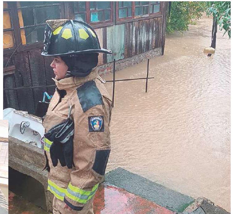
En la reunión efectuada en la DOH se estableció que se harán obras de mitigación en el Estero Pochochingue, el cual que ha generado serios problemas a sus vecinos.