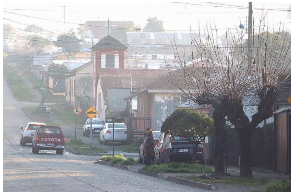
Una verdadera ola de robo está afectando a las viviendas del Barrio El Cañón, en Angol.

Un dirigente agregó que tienen 160 alarmas comunitarias para proteger a 600 casas, pero tienen que hacer algo para que los vecinos realmente las usen, porque esto no está ocurriendo. “Están funcionado, pero hay que reactivarlas