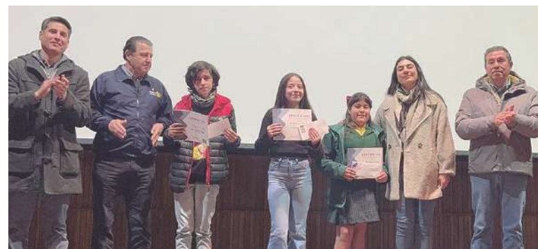
Los ganadores en la categoría niños y niñas.

De total de fotos recibidas, 40 fueron seleccionadas, incluida las ganadoras, y están exhibidas en el Centro Cultural hasta el viernes 30 de agosto.