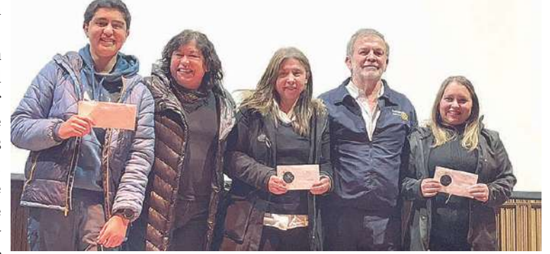
También se entregaron menciones honrosas.