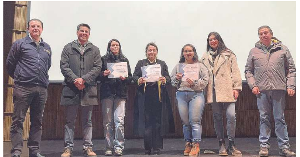
Premiación de los ganadores en la categoría adultos.