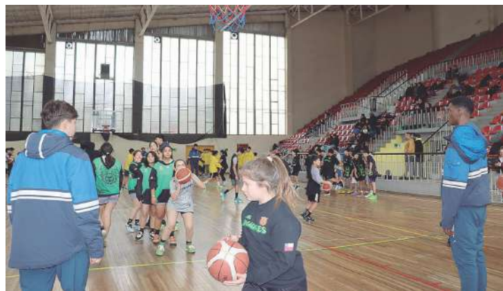
Las clínicas fueron efectuadas ayer miércoles en el gimnasio municipal de Angol.

La primera clínica se efectuó para niños y niñas deportistas de entre 9 y 12 años, para luego los basquetbolistas de la UC