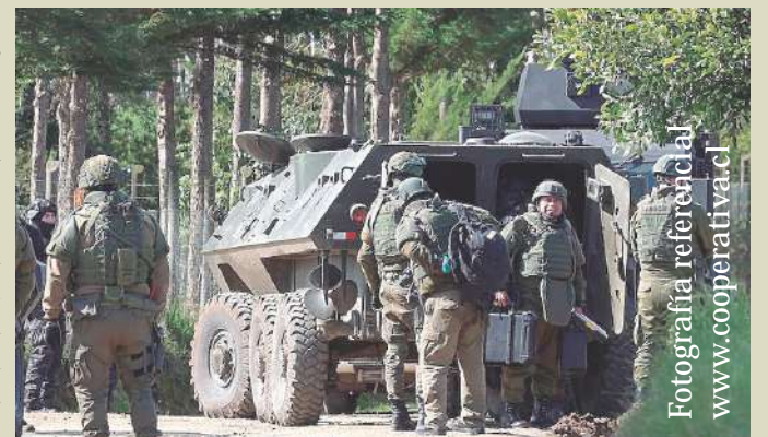
Fotografía referencial www.cooperativa.cl

La Coordinadora Arauco Malleco (CAM) se habría adjudicado el ataque,