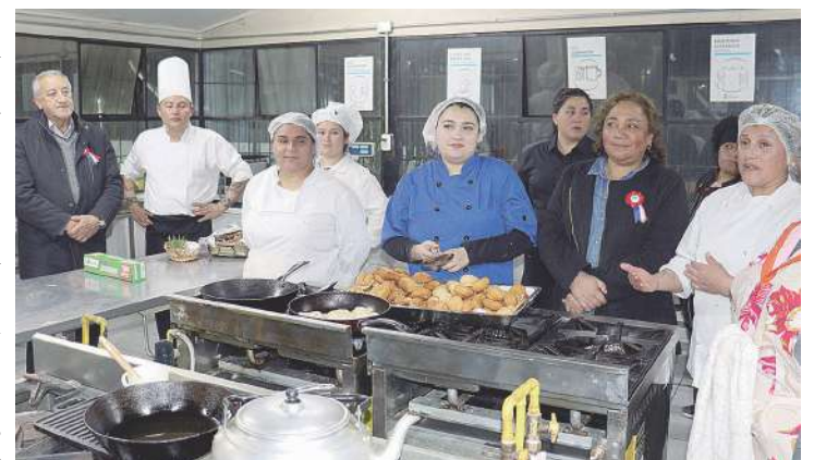
Con las alumnas y el alumno de Servicios de Alimentación Colectiva.