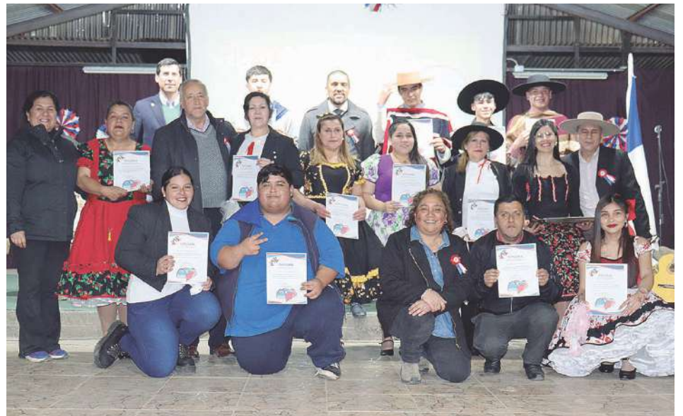
Entrega de reconocimientos a los alumnos y alumnas que participaron en el taller de cueca.

campesina, bailaron para los presentes. Acto seguido las autoridades e invitados se dirigieron a una amplia y equipada cocina del establecimiento, donde saludaron a las alumnas y el alumno que siguen la