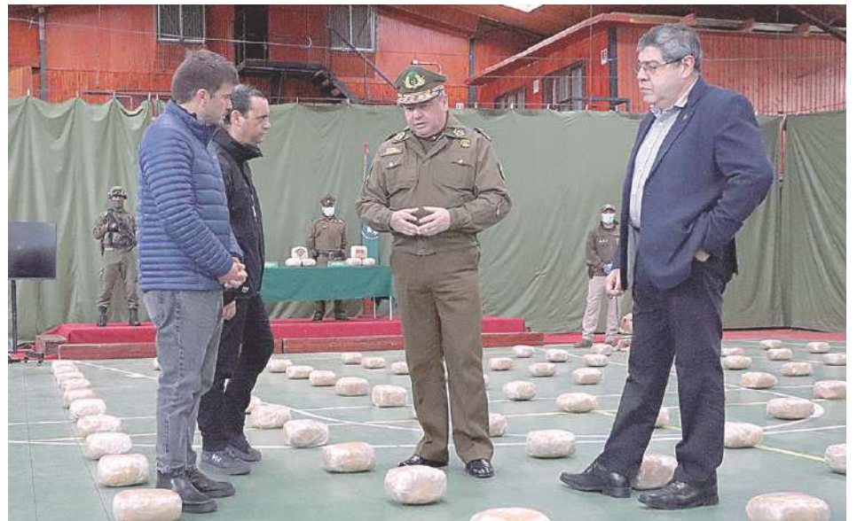
Las autoridades entregaron antecedentes del mayor decomiso de droga en La Araucanía en los últimos 10 años.