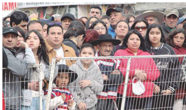
Numeroso público asistió a presenciar el desfile con motivo de la celebración de la independencia de Chile.

Pasaron unidades de formación de Carabineros, la