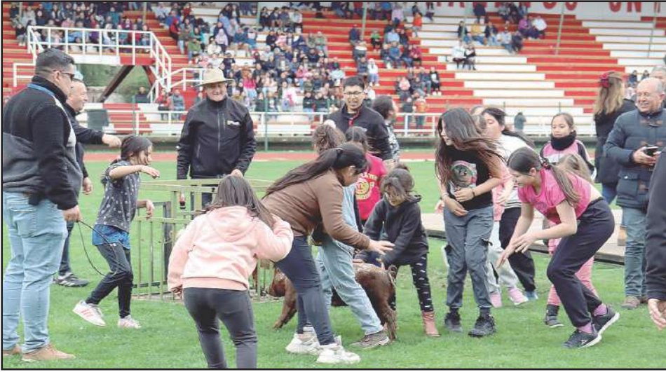
Muchos niños y niñas corrieron para atrapar al chanco encebado.