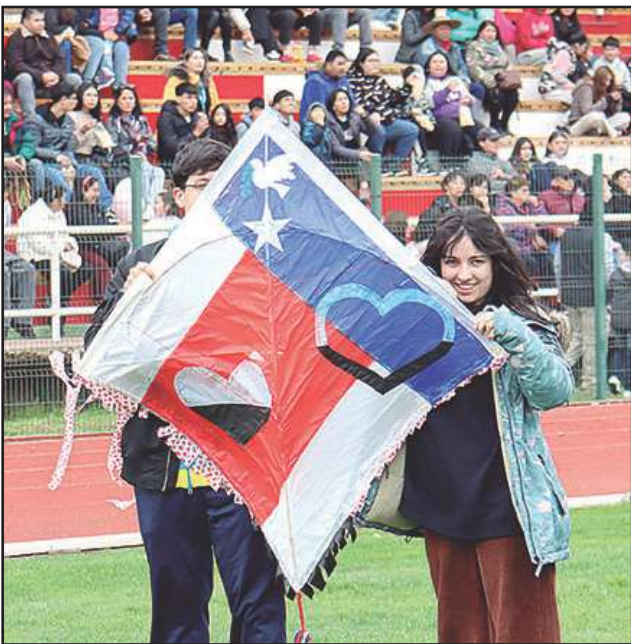
También se premió al volantín más bonito y al que fue elevado más alto.