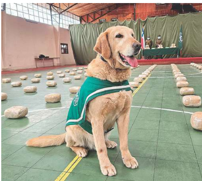
El trabajo del perro policial "Dubai" fue clave para detectar el cargamento de la sustancia ilícita.

Estos traficantes -dijo el general Cifuentes- si creían que con motivo de las Fiestas Patrias no se iban a efectuar controles carreteros especializados de Carabineros estaban equivocados, ya que seguirían efectuando su trabajo especialmente en estos días, agregó.