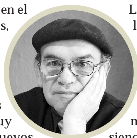
Por Miguel Ángel Roa Riosco

La ley es obligatoria para todos en concurrir a sufragar. Este solo hecho por sí mismo puede decidir la elección en algunas comunas del país y ninguna está asegurada de antemano aunque haya favoritos como es natural. Los nuevos votantes serán en su mayoría jóvenes que recién se incorporan al padrón electoral y ellos pueden decidir una elección en cualquier comuna.