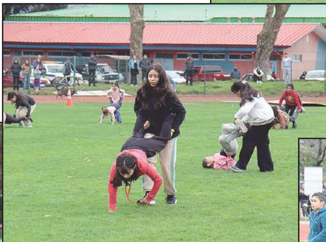
Fueron distintas y entretenidas pruebas en las que participaron decenas de niños y niñas.