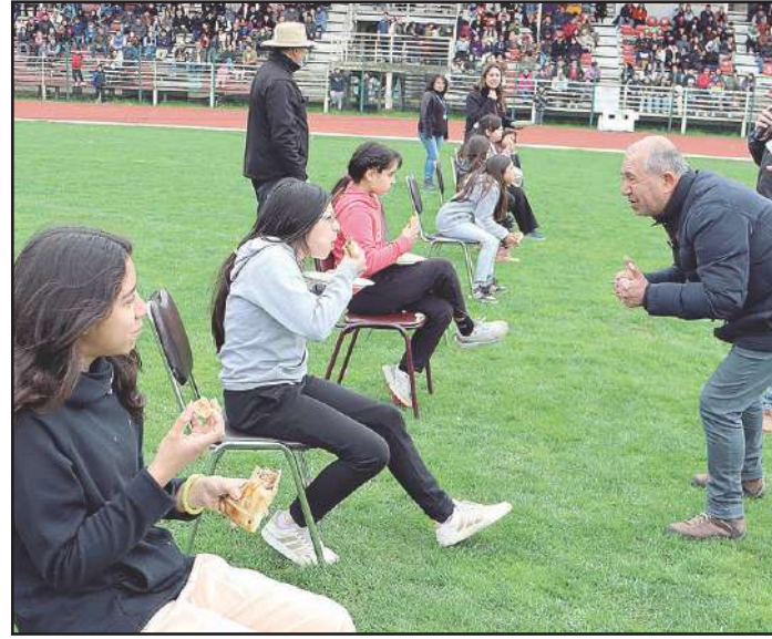
Una de las pruebas más entretenidas fue la yincana.

Se realizaron el viernes en el Estadio Alberto Larraguibel Morales