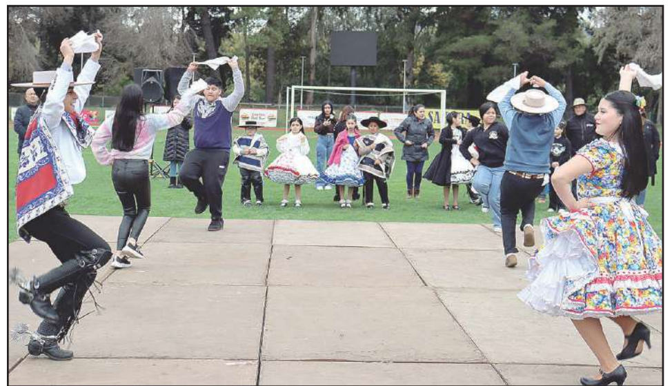
Hubo competencias de cueca para niños y adultos.