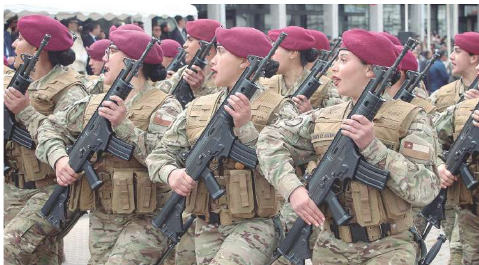
Soldados conscriptos mujeres desfilaron antes las autoridades en la ceremonia cívico Militar.

Después se entregaron reconocimientos y se realizó un esquinazo. Se dio paso al desfile, oportunidad en que