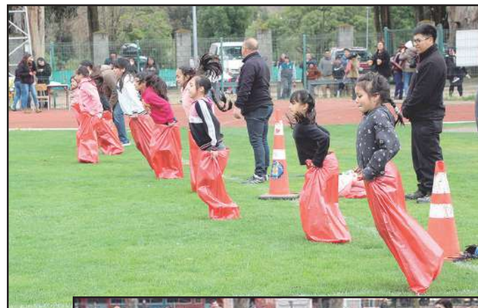
Niños y niñas de distintas edades corrieron ensacados.