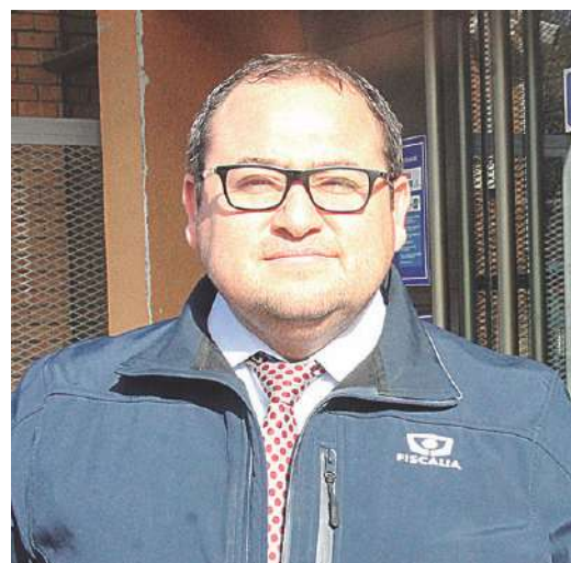
La formalización de cargos la efectuó el fiscal Luis Espinoza.

En este caso no se entrega el nombre del imputado para evitar la identificación de la afectada y una doble victimización de ella.