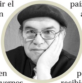
Por Miguel Ángel Roa Rioseco

Primavera es reverdecer y volver a vivir el resplandor del sol abriendo las flores y con ello el vuelo de los pájaros y las mariposas y abejas prontas a polinizar los rutilantes y fragantes estambres y corolas; recorrer pétalos aterciopelados, finos, coloridos y alegres hasta tocar nuestros ojos con la belleza sublime de nueva vida, de alegría joven como un tallo. Así la primavera suele conmovernos a todos, desde el vuelo de volantines septembrinos hasta el estallido, declarando su llegada pegada a sublimes versos de decenas de poetas del mundo, que han expresado la alegría de la juventud representada en la naturaleza por la primavera. Pero hay situaciones oscuras que afectan a la primavera, a las plantas y a las flores y con ello a las mariposas y abejas, también a quienes cuidan en sus jardines estas joyas. Porque el hombre y su circunstancia, como decía Ortega y Gasset, suele ser destructor de la naturaleza, enemigo de árboles y plantas. Es la cultura de la destrucción, que en nuestro