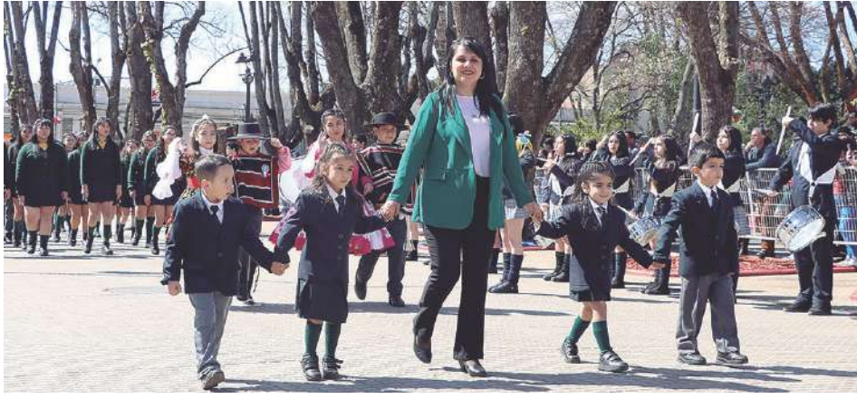
Participaron establecimientos municipalizados y particulares subvencionados.