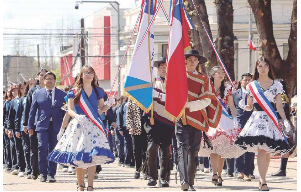
Con serena emoción desfilaron profesores y alumnos para homenajear a la patria.