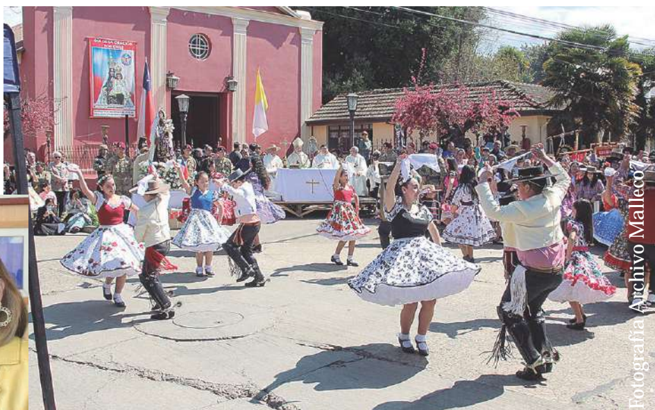
La Oración por Chile se realizará el próximo domingo en el frontis de la Parroquia san Buenaventura.

por Chile “es transversal, porque hay que concentrar las raíces y las tradiciones que tenemos, sobre todo como país y como región, especialmente como Angol”.