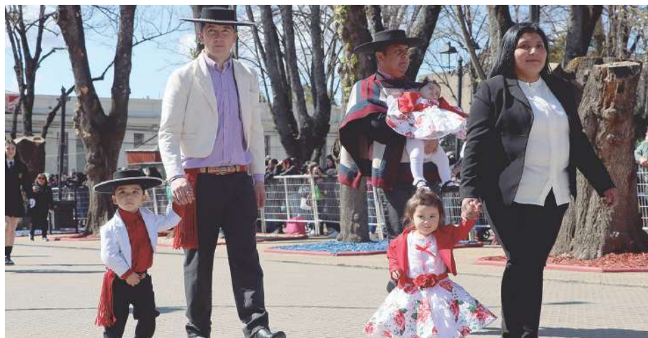
Muchos papás y mamás llegaron a ver desfilan a sus hijos.