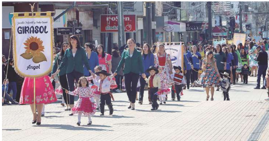
Los peques se lucieron con sus trajes de huasitos y chinitas campesinas.