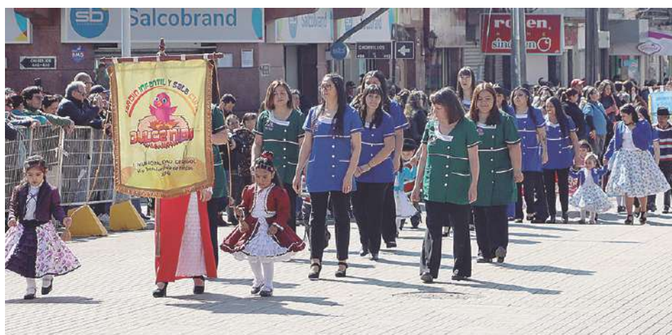
Las tías guiaron a los peques por la calle Lautaro.