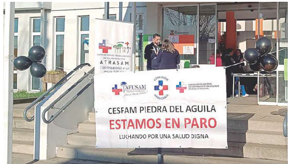
La movilización nacional concluye hoy jueves, a las 20 horas en Angol.

Otras deudas ministeriales, en que no han se traspasado los recursos a los municipios es para pagar asignaciones de desempeño difícil. Exigen la aplicación