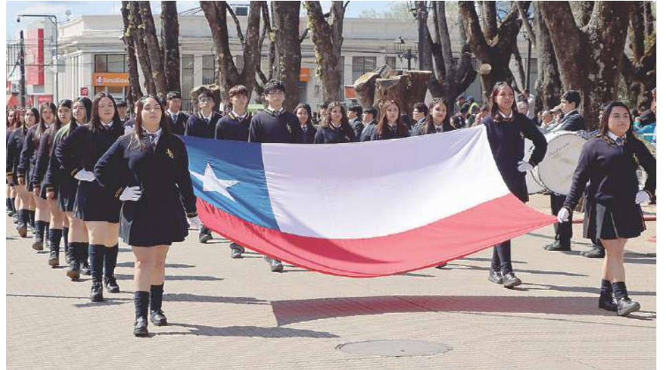
Los símbolos patrios estuvieron muy presentes en el desfile de las y los alumnos.