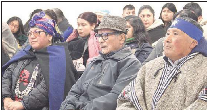
Comunidades mapuches de Victoria, en la Provincia de Malleco