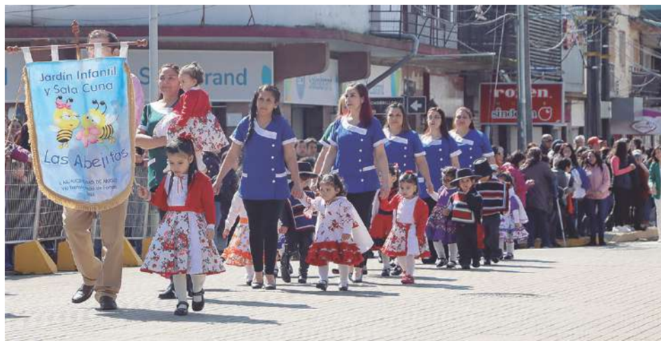
Niños y niñas de 11 jardines infantiles participaron en el desfile.

En desfile efectuado el martes en calle Lautaro, en Angol