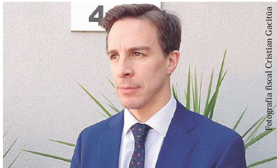
Fotografía fiscal Cristian Gacitúa

La acusación agrega que "al tiempo que G.I.S.B. lo agredió propinándole reiterados golpes de pie en el rostro, en el cráneo y en el resto del cuerpo, ejecutando ambos las referidas agresiones incluso mientras la víctima estaba tendida en el suelo".