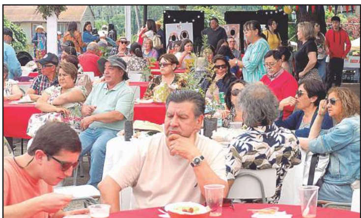
Residentes y visitantes vivieron una jornada inolvidable en la plaza principal de Pastene.

Además de la gastronomía intercultural, el talento de los artesanos de la zona también tuvo un lugar de honor, en una fiesta que integró bailes y música en vivo, con ritmos tradicionales y contemporáneos.