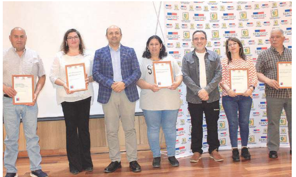
En la ceremonia los beneficiados recibieron su certificación para permitirles reactivar sus negocios.

Epuin recordó que el programa fue gestado por la Delegación de Malleco, la Municipalidad de Angol, Sercotec, "donde acudimos al Gobierno Regional, para solicitar la plata y poder desarrollar una iniciativa que pudiera recuperar la actividad comercial en una avenida, la cual ha sido muy golpeada y, por lo tanto, esas Mipymes requieren reactivarse económicamente. Ellos apoyaron nuestra propuesta y no entregaron los recursos".