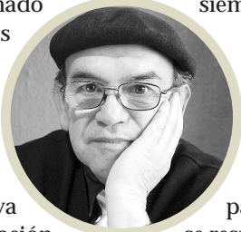
Por Miguel Ángel Roa Rioseco

La delincuencia parecía tener temores de ser descubierta y sancionada. No existían sanciones como "detención domiciliar", "no poder acercarse a menos de 200 metros de la víctima", "conducta anterior irreprochable", como si esto último fuera un mérito y