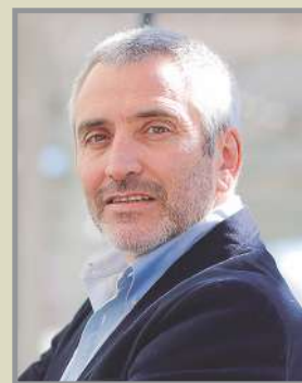
Por Felipe Vergara Maldonado, analista político, Universidad Andrés Bello.

Esta guerra comercial podría llevar consigo un nuevo encuadre territorial, es decir, modificar las alianzas tradicionales de Estados Unidos, ya sea a través de acuerdos de libre comercio o por afinidad estratégica y/o política. Hoy en día, por ejemplo, México, Canadá,