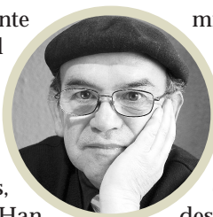
Por Miguel Ángel Roa Rioseco

Era octubre de 1957, cuando profundamente asombrados, veíamos la huella de luz del Sputnik que surcaba el espacio de nuestro cielo austral como el de todo el mundo, en un salto que dio comienzo a la llamada "carrera espacial", entablada entre la entonces Unión Soviética y Estados Unidos, dispuestos a ganarla a como fuera lugar. Han pasado 68 años, que casi no nos hemos dado cuenta, y hoy día esa hegemonía espacial alrededor de la tierra es