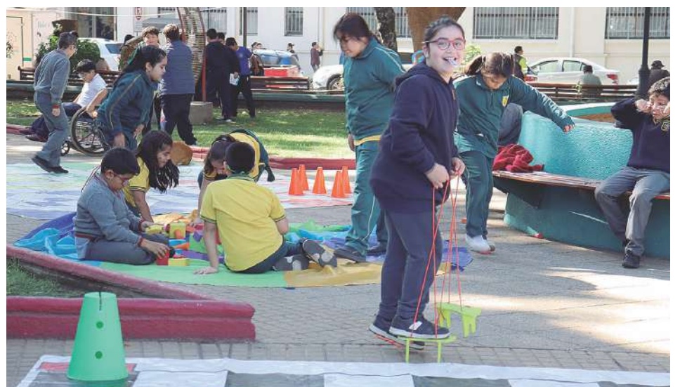
Niños y niñas disfrutaron de los juegos dispuestos para ellos.