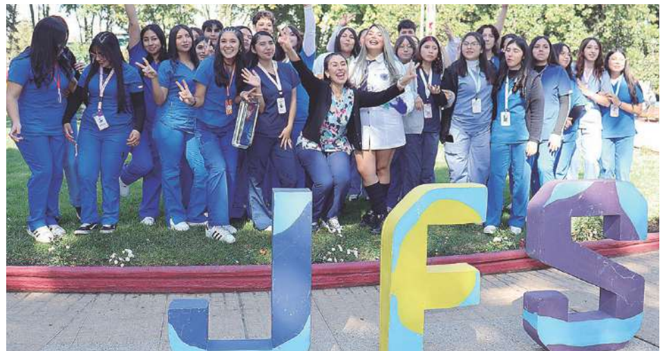
Alumnas y alumnos de Atención en Enfermería con Mención en Adulto Mayor del Liceo Juanita Fernández Solar prestaron servicio a las personas.