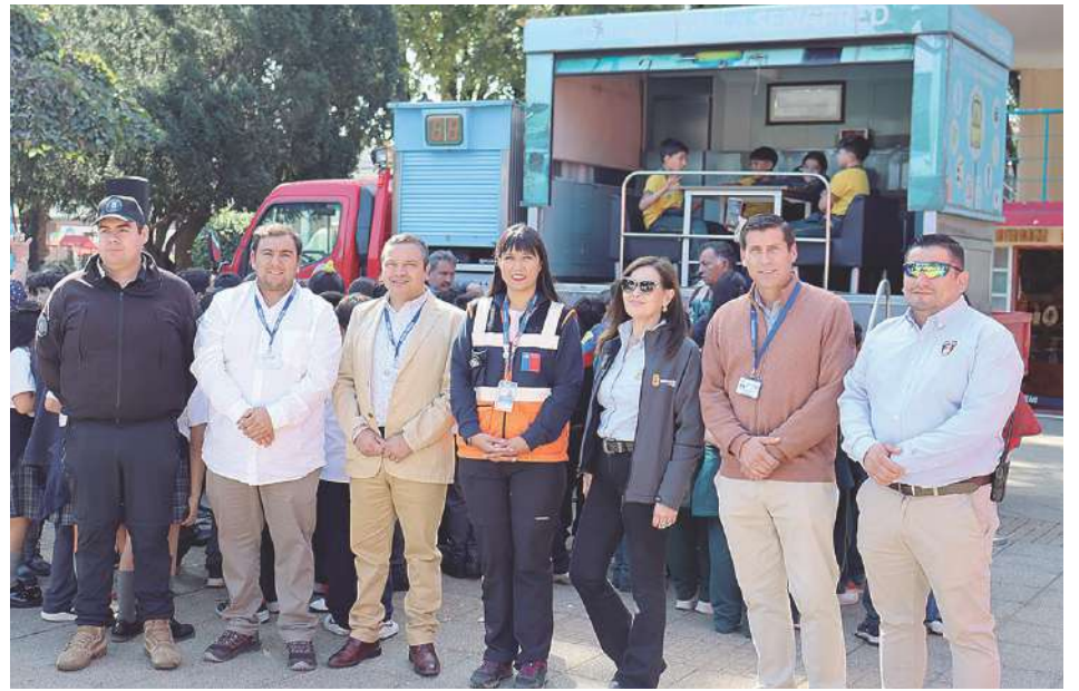
Representantes de varios de los organismos que participaron en la actividad.

En torno a Simulador Sísmico traído por Senapred