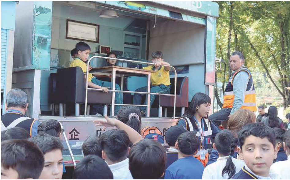
Muchos niños y niñas se subieron al Simulador Sísmico montado sobre un camión.