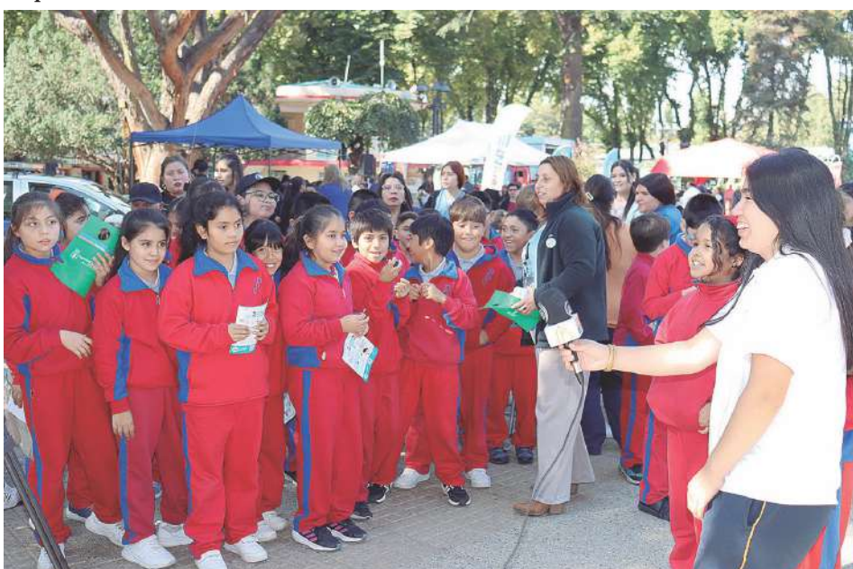
Una “reportera” del Colegio Diego Dublé Urrutia entrevistó a compañeros.