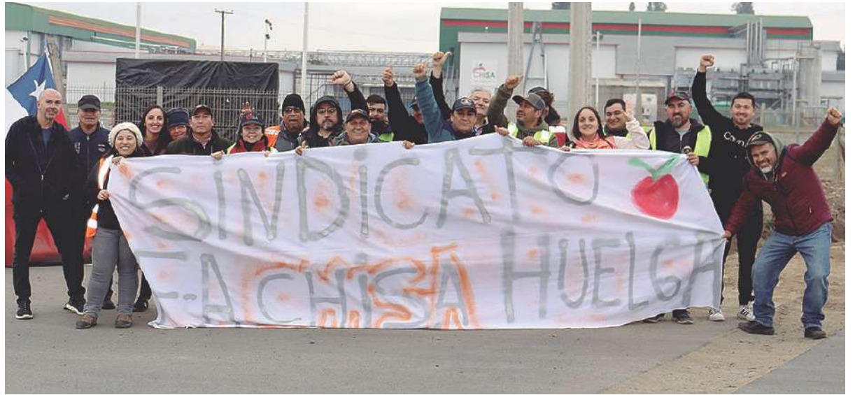
Los trabajadores en huelga legal se movilizaron ayer afuera de la planta de la Frutícola Angol.

Agregó que están buscando algunas mejoras salariales, como un bono que tenían con la administración anterior de la planta, el cual perdieron con los nuevos encargados. “Nos encontramos en la iniciación de nuestra huelga después de haber tenido un amplio tiempo en el cual podríamos haber llegado a un buen acuerdo con la empresa, pero lamentablemente ayer, en los últimos minutos de negociación, la empresa no quiso acceder a parte de nuestro petitorio, que el más importante era remuneración,