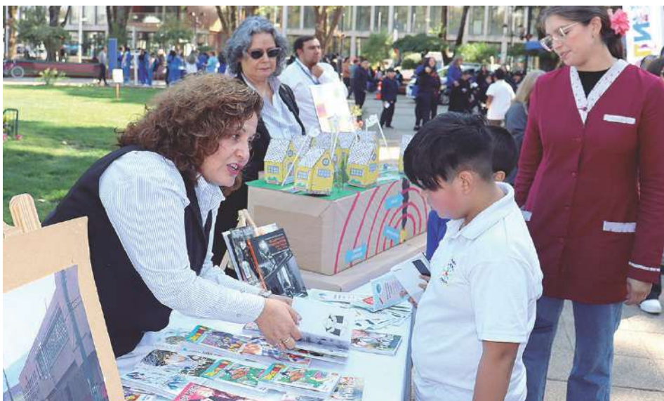
La Biblioteca Municipal educó respecto a qué son los terremotos y por qué se producen.