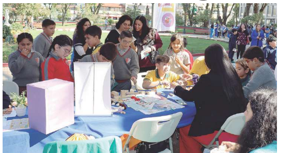
Hubo tres organismos relativos a la niñez entregando información.

la Municipalidad, hubo una representación del Cuerpo de Bomberos de Angol, que entregó a los niños y niñas información de cómo trabajan en situaciones complejas generadas por los terremotos; la Biblioteca Municipal que clarificó en qué consisten los mismos y por qué se producen; y la Oficina Local de la Niñez que se centró en cómo los peques pueden controlar sus emociones ante hechos de este tipo. Entre otros también estuvo entregando información Seguridad Pública.