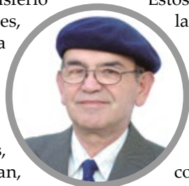
Por Miguel Angel Roa Rioseco

Las noticias diarias van siendo cada vez más trágicas. Casi despiadadas en su contenido. Mientras los niños de nuestro hemisferio juegan alegres y descubren las flores, caminan y recorren senderos nuevos para sus ojos llenos de curiosidad y asombro, otros niños mueren en Gaza, indefensos, con ojos despavoridos, mutilados por la metralla de hombres armados y enceguecidos mientras ellos, descalzos, enflaquecidos por la hambruna, caminan, tratan de refugiarse e igual son ametrallados para que dejen de existir como grupo humano. Otros, los que sobreviven, están mutilados, sin piernas o brazos, y sin futuro porque nada tienen. Es el ataque de uno de los ejércitos más poderosos del mundo que también destruye los hospitales que logran atender a los miles de heridos. El más reciente ataque destructivo y mortal fue al Hospital Nasser de Gaza. Más de 20 personas perdieron la vida ya sea como pacientes o como personal de salud ayudando al prójimo. Junto a ellos, cinco periodistas fueron ultimados cumpliendo su misión de informar al mundo lo que allí ocurre desde hace casi dos años. En este hecho se produjo lo que en jerga bélica se llama un "doble golpe", es decir dos ataques uno tras otro, en el que se busca el exterminio total que siempre recae en civiles que auxilian o en quienes informan como son los