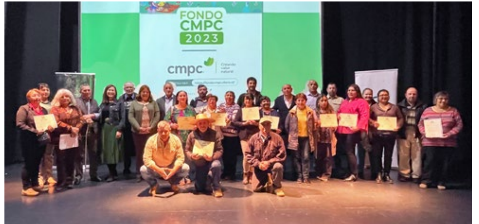
Desde su creación este Fondo ha financiado proyectos en Angol, Collipulli, Lumaco, Victoria, Angol, Renaico, Ercilla, Los Sauces, Purén y Traiguén.

M ALLECO.- Por décimo año consecutivo, el Fondo Social CMPC dirá presente alimentando los sueños de cientos organizaciones sociales de 54 comunas del centro-sur de Chile. Este 2025, y en alianza con CIDERE Biobío, abre nuevamente sus postulaciones para impulsar proyectos que mejoren la calidad de vida de miles de vecinas y vecinos.