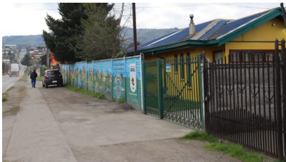
Un total de 9 robos fueron cometidos en el jardín infantil Girasol de Angol en sólo tres meses.

Malleco7 conoció que todos estos delitos afectaron al personal que trabaja