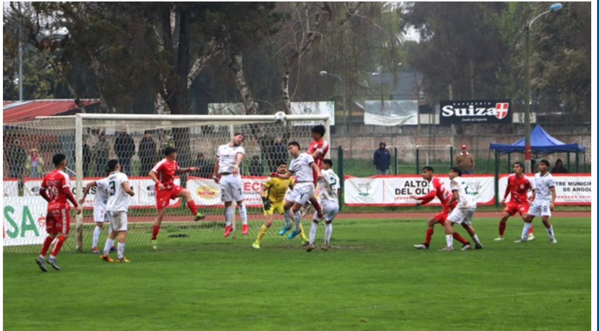
Malleco Unido consiguió un trabajado triunfo el domingo ante Chimbarongo F.C.