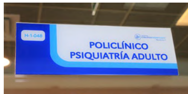
Una de las ciudades donde se buscará reforzar esta atención es Angol.

Malleco7 dialogó en la Escuela José Elías