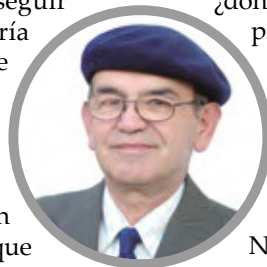
Por Miguel Angel Roa Rioseco

demostrado que la materia y la antimateria estaban en el comienzo del universo en igual cantidad. Las preguntas que se hacen los científicos son ¿qué pasó, qué es la antimateria? , ¿qué pasó en el momento del Big Bang? Y lo que es más complejo, ¿dónde está la antimateria que se debe haber producido entonces? La materia es todo lo que conocemos, lo que se ve y se toca y se siente y percibimos con nuestros sentidos desde que nacemos. Y entonces si sabemos que la materia nos ha rodeado siempre y hemos vivido en ella y junto a ella, ¿dónde está la antimateria? No lo sabemos y esa interrogante junto con otras son las que los científicos del CERN están investigando desde hace tiempo, y es seguro que puede pasar mucho tiempo aún, más allá de nuestra terrenal existencia, para que se tenga una respuesta. Es una experiencia alucinante, una tarea de grandes científicos e investigadores que sobrepasa nuestra imaginación y nuestra propia vida terrenal.