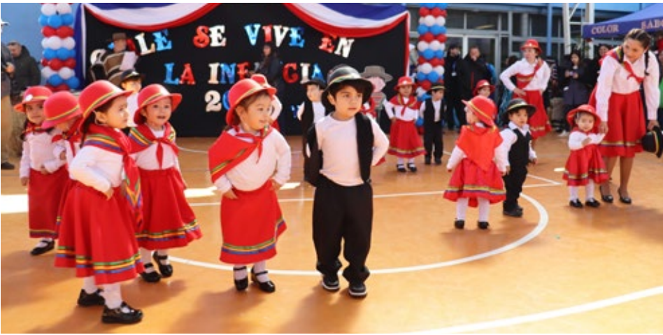
La presentación del Jardín infantil y sala cuna Estrellitas del Rosario.