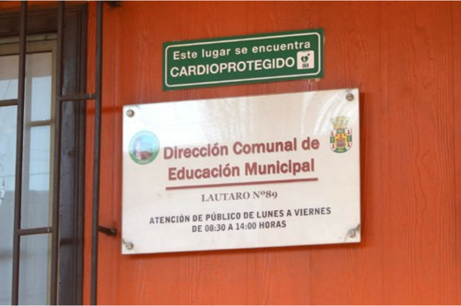
El Concejo Municipal deberá decidir hoy martes si aprueba los recursos para el Departamento de Educación Municipal.

Beltrán destacó que en el Concejo creen que hay que trabajar para mitigar los daños, “pero también hay que velar por una administración responsable en el futuro, eso es clave para garantizar que el sistema sobreviva y que no tengamos que pasar estas crisis tan feroces que perjudican no solamente al sistema, sino que también a las personas”. Finalmente dijo que “tenemos bastante confianza en la nueva administración del DEM, creemos que el director tiene la capacidad técnica, así lo ha demostrado con gestos concretos; creemos que es bueno respaldar el sistema, siempre y cuando estos recursos se inviertan para mejorarlo y no para darse ciertos gustos personales que no contribuyen al desarrollo de la comuna”.