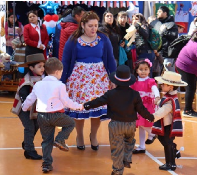
Jardín infantil El Parque.