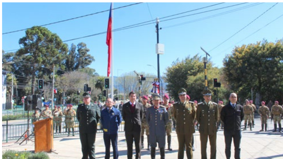
El viernes se realizó ceremonia de Izamiento del Pabellón Patrio en la esquina de Plaza Bunster en Angol.

Agregó que las actividades previstas para este mes de celebraciones se