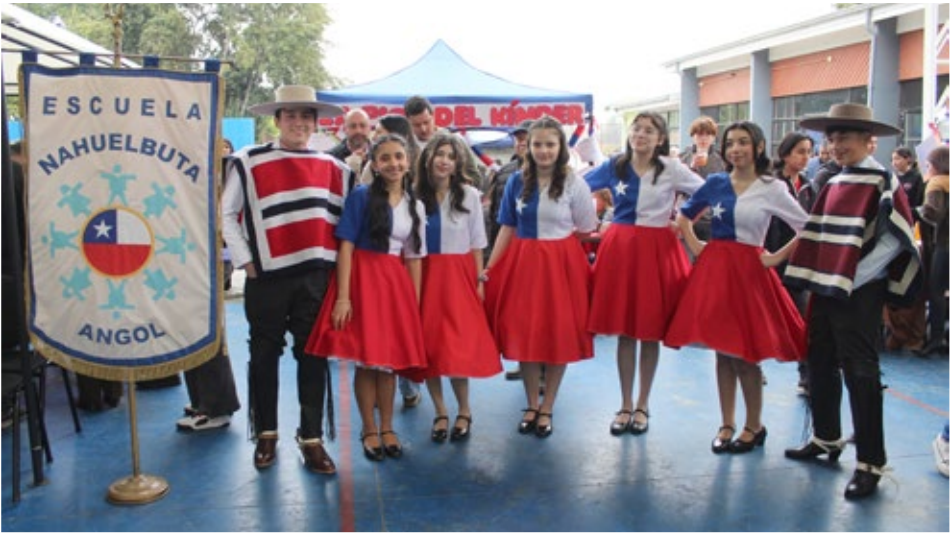
En la Escuela Nahuelbuta los alumnos participaron con entusiasmo en cada una de las actividades.

CELEBRACIÓN La Escuela Nahuelbuta fue escenario de una masiva celebración, donde hubo 18 stand, con diversas