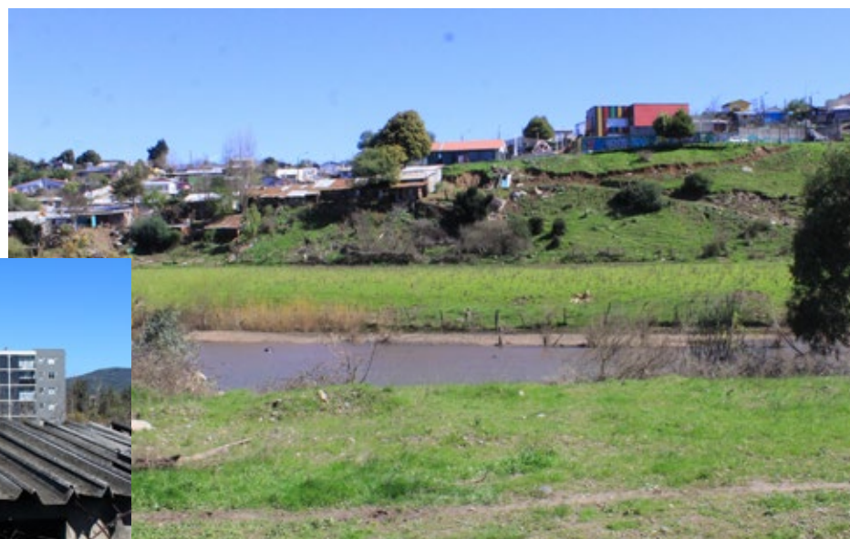
En el Condominio Las Rocas 2 hay preocupación por las transacciones de drogas que se hacen junto a un acceso del conjunto habitacional. También preocupa un sitio eriazo.

información que hay personas que cruzan el río (Vergara), desde la Población Nahuelbuta y llegan junto a uno de los portones de acceso del condominio para transar drogas con gente que los espera acá y que viene de otros sectores”.