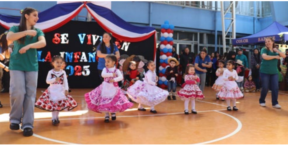
Una guaracha del Jardín infantil y sala cuna Pequeño Solcito.

ANGOL.- Una mañana de ternura infantil y tradiciones chilenas se vivió el jueves en la Escuela José Elías Bolívar, donde se desarrolló la Primera Muestra Folclórica de los Jardines VTF de Angol, Chile se vive en la infancia, en la cual participaron los 12 jardines infantiles y salas cunas de esta ciudad con esta modalidad de administración. Participaron los jardines y salas cunas Los Cisnes, Pequeño Solcito, Diego Dublé, Girasol, Estrellitas del Rosario, Manitos de Colores, Semillitas de Huequén, El Parque, Dulce Nido, Abejitas, Sala Cuna Liceo Comercial y Primeros Pasitos, cuyos niños y niñas, acompañados por sus tías, presentaron