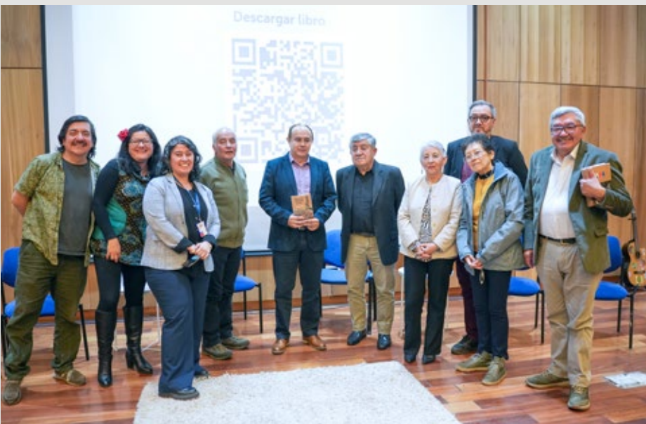
El libro puede ser visto y descargado desde el sitio web del Ssan, en el apartado de publicaciones del Prais.