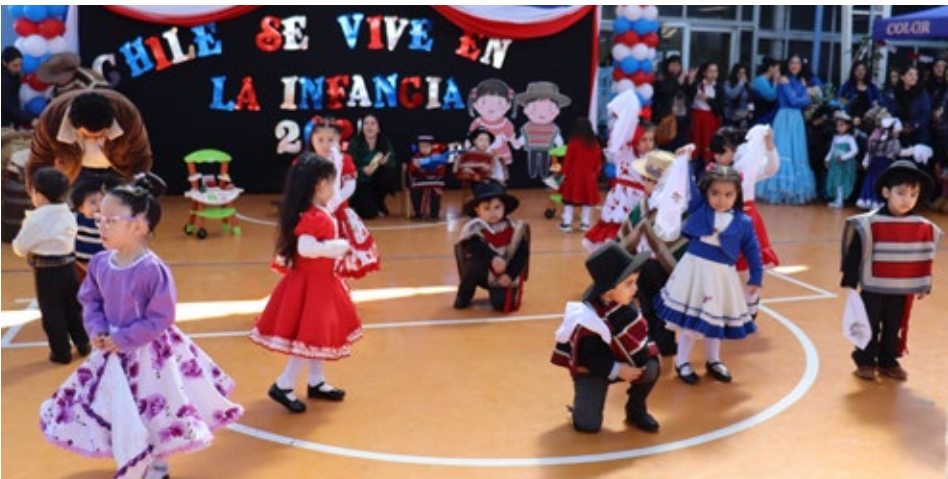
La presentación del Jardín infantil y sala cuna Semillitas de Huequén.