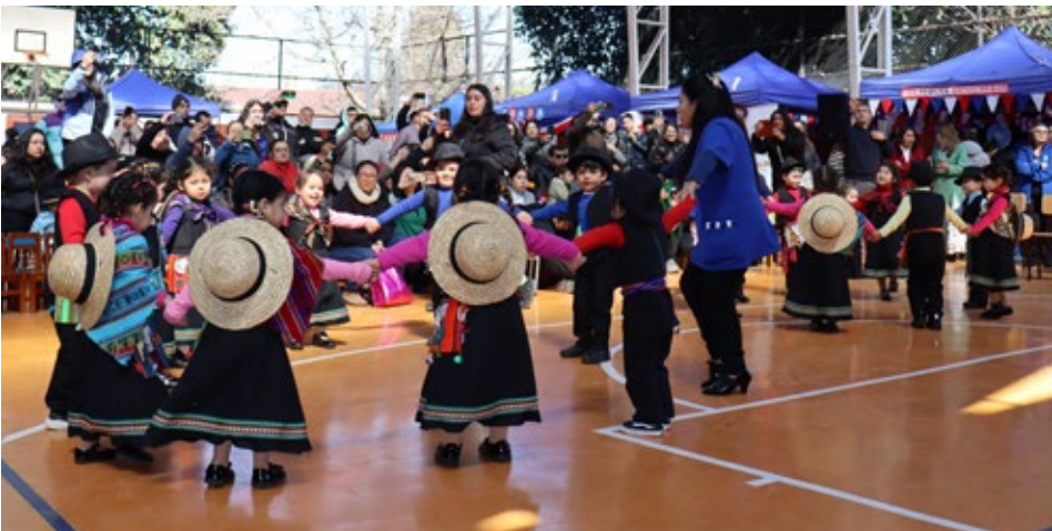
La actuación del Jardín infantil y sala cuna Manitos de Colores.