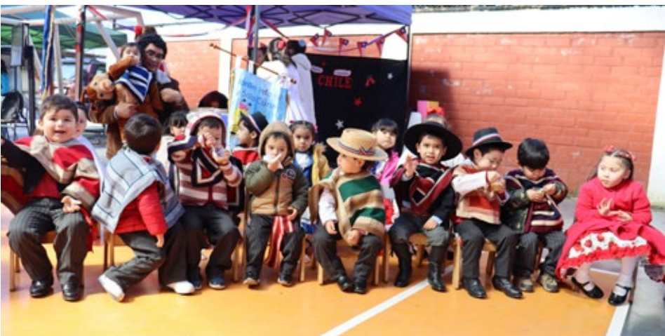
Pequeños huasitos y chinitas disfrutando de alimentos típicos.