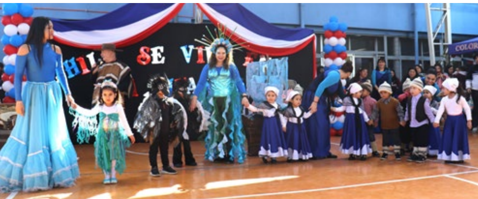
El jardín infantil y sala cuna Girasol efectuó una presentación folclórica de Chiloé.