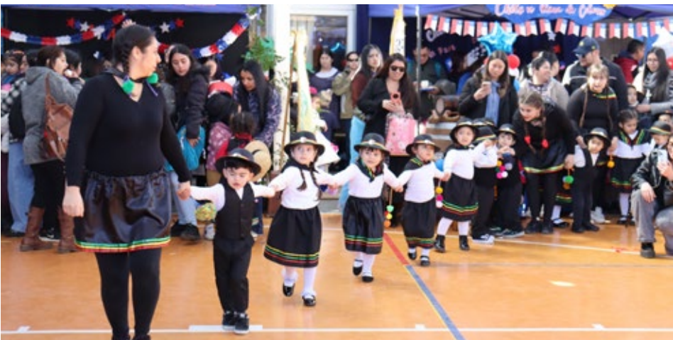
El momento de la actuación del Jardín Infantil Los Cisnes.