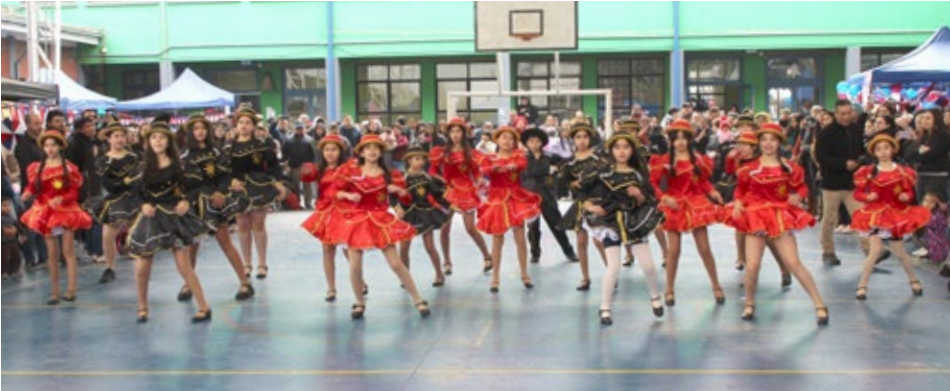
Las presentaciones realizadas por los estudiantes de la Escuela Nahuelbuta encantaron a los asistentes.

Ambas actividades fueron amenizadas con shows preparados por los alumnos, como ocurrió en la