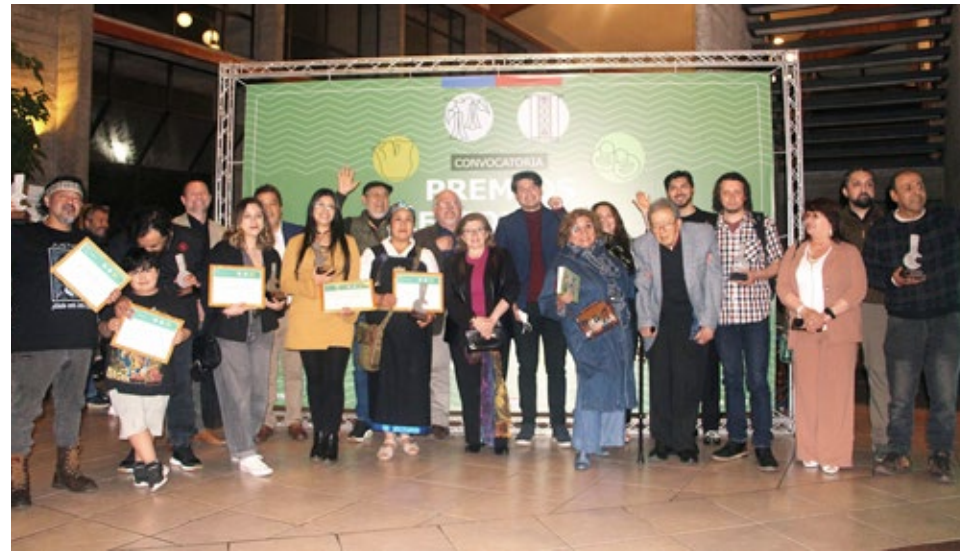
Fueron premiados artistas de distintas comunas de la Región de La Araucanía.

Los ganadores obtuvieron un estímulo de $1.750.000 y las menciones honrosas, $750.000. Además, las y los reconocidos recibieron un galardón diseñado y elaborado por el artesano