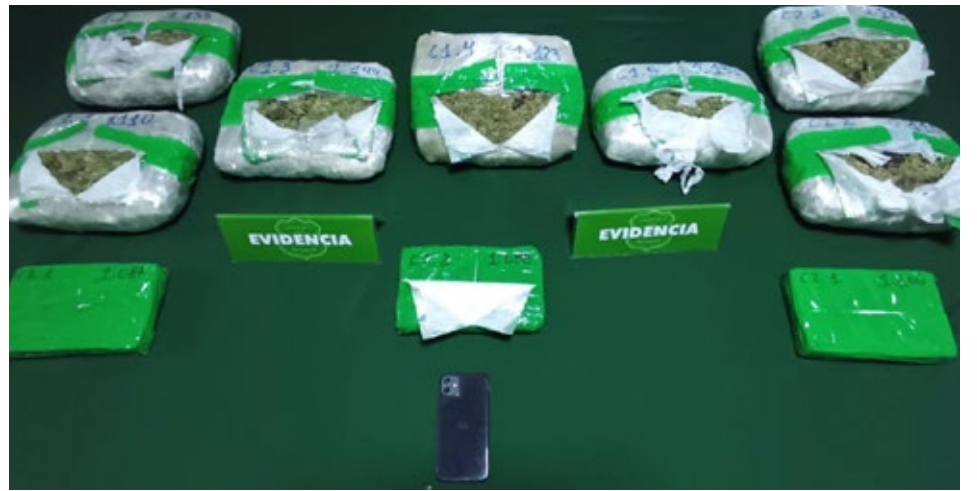
La droga incautada al detenido por el OS-7 de Carabineros.

ACTITUD EXTRAÑA El jefe de Zona Carabineros Araucanía,