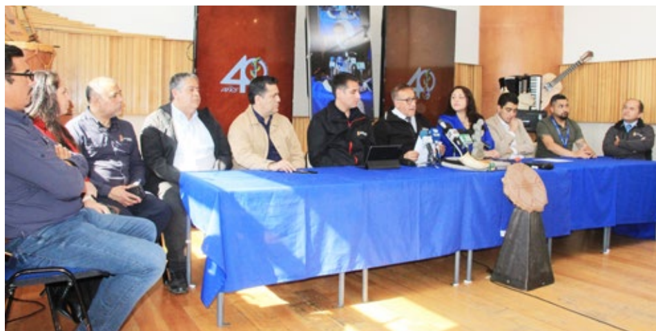
La presentación de los detalles del Festival Brotes de Chile se realizó en el segundo piso del Centro Cultural de Angol.

Aclaró que el proceso se realiza con una parrilla tentativa definida, donde nuestro único interlocutor válido entre la municipalidad y la productora es el Portal de Mercado Público, “por tanto, técnicamente en el caso que el Comité proponga a un artista y no está disponible, siempre está la posibilidad de que se busque a uno de similares características”.