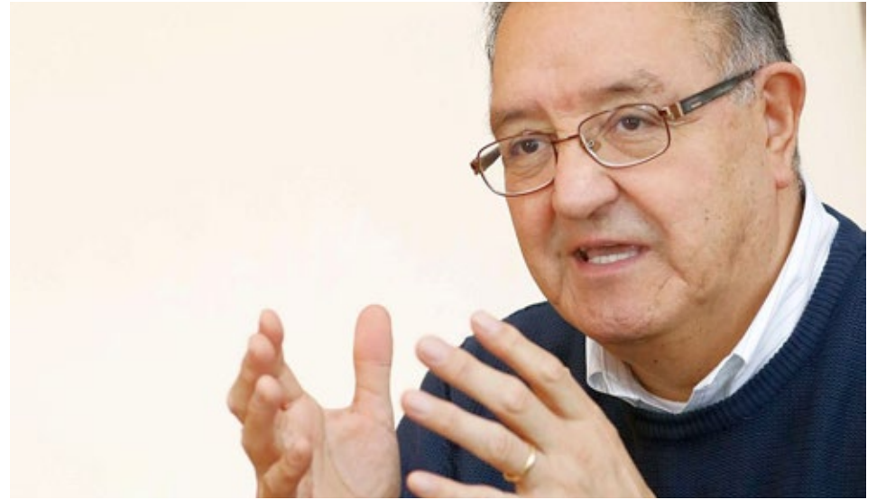
El senador por región de La Araucanía, Francisco Huenchumilla Jaramillo.

Respecto de quién administraría los nuevos centros, el senador plantea que “esta podría ser una iniciativa de los