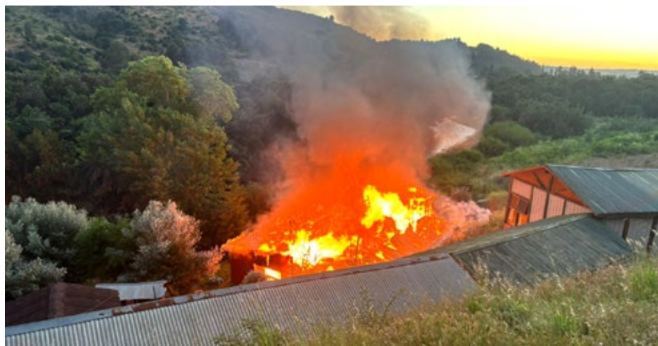
El fuego destruyó completamente tres cabañas del recinto ubicado por la Ruta 182, en el sector Alto Cancura.

Por instrucción de la Fiscalía de Primera Diligencias, en el lugar las