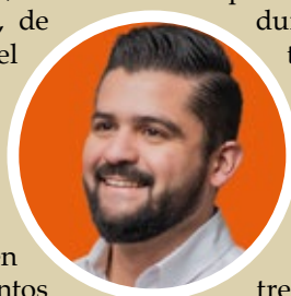
Por Maximiliano Radonich

En tiempos electorales, lo realmente destacable no está en agredir o atacar al que piensa parecido, sino en saber convivir con los matices, entendiendo que se debe priorizar al colectivo por sobre lo individual, no olvidando que las convicciones se defienden con visión y respeto, no con rencores. Tomando lo que dijo Arjona en una canción, en este caso llevado al tema político, la unidad y respecto deben ser verbo y no sustantivo.