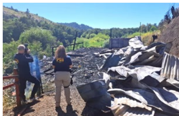
En el sitio del suceso trabajaron peritos de las unidades Bipe y Lacrim de la PDI.

generó poco antes de la seis de la mañana y afectó a tres cabañas pareadas que estaban en el extremo oriente de este complejo, a las cuales se podía acceder por interior del recinto y por un camino interior que está paralelo a la Ruta 182.