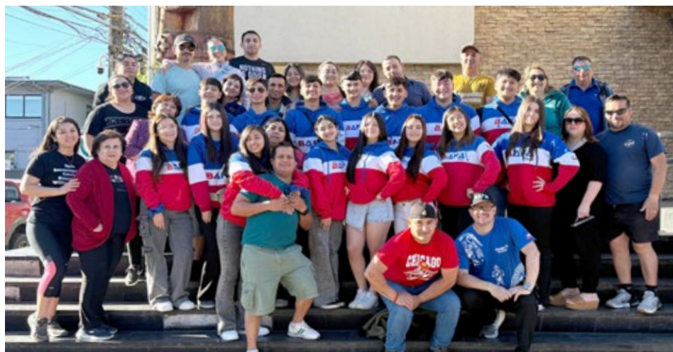
Los padres, madres y familiares fueron a dejar a los integrantes del Bafa al Centro Cultural de Angol, desde donde viajaron al aeropuerto de Concepción.