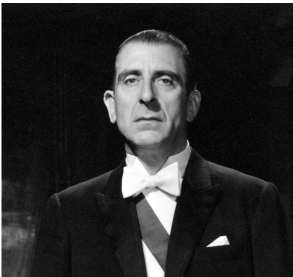
Para Francisco Huenchumilla el actuar de Eduardo Frei lesiona la memoria histórica de su padre, el ex Presidente Eduardo Frei Montalva, y de su partido, la Democracia Cristiana.

Para Francisco Huenchumilla es incompatible ser demócrata cristiano y apoyar a Kast, porque el partido institucionalmente tomó una decisión distinta, por lo que el ex Presidente Frei no puede poner este cargo que ocupó sobre la militancia. "No puedes tirar tu cargo de ex Presidente encima de toda la militancia modesta de la Democracia Cristiana y decirle porque soy yo hago lo quiero, ¿eso es correcto?, a mi juicio no es correcto, ahora qué vamos a decidir, lo veremos mañana", dijo el senador.