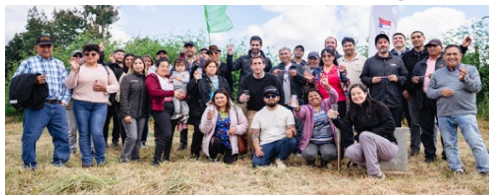
Todos los asistentes a la inauguración se tomaron una fotografía para recordar esta importante actividad.

Hoy, en Margarita Huenchumán, el agua corre, se acumula, se distribuye y se convierte en certeza. No es solo infraestructura: es seguridad, es salud, es futuro. Y es también un recordatorio de lo que la gestión ágil, el trabajo en equipo y el compromiso territorial pueden lograr.