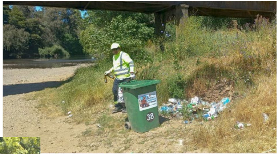
Ya comenzaron los trabajos de limpieza y habilitación de los espacios recreacionales de La Peta, La Arcadia y El Manzano.