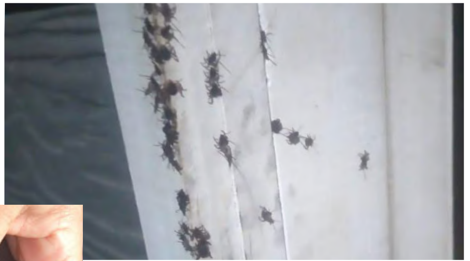
Las garrapatas están ingresando a las casas, como denuncian vecinos de Las Rocas 2, afectando a muchos perros.

los perros que son más propensos a ser infectados.