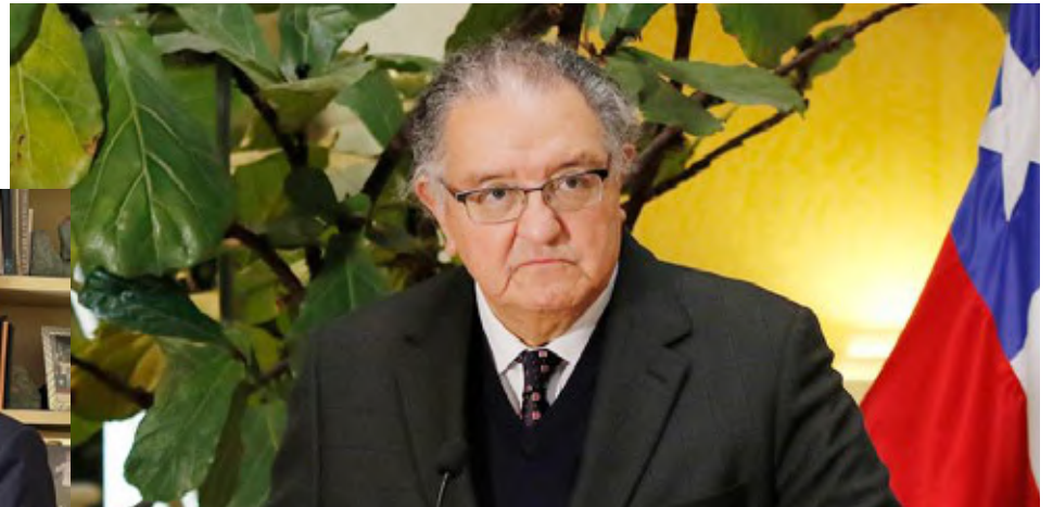
El senador cuestionó que ex Presidente Eduardo Frei, militante DC, se haya reunido ahora, en el periodo de campaña, con José Antonio Kast.