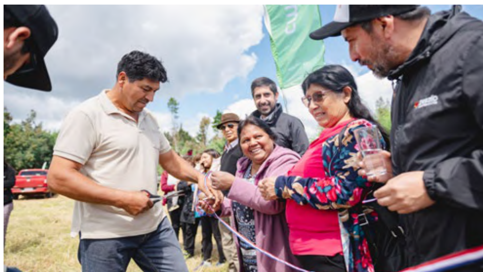
El momento del corte de cinta para dar por inaugurado la concreción del proyecto de agua para la comunidad.

El proyecto es parte de los 100 sistemas de agua ejecutados por CMPC y Desafío en solo cinco años, una cifra que demuestra la