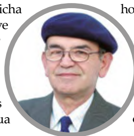
Por Miguel Angel Roa Rioseco

carbón, gas natural o producción de electricidad por consumo de combustible diésel, encareciendo aún más el producto final que es la electricidad hogareña, con la cual vivimos para alimentarnos y abrigarnos. Así se concluye que las mediciones de agua en embalses, lagunas y vertientes, junto con las reservas de agua de las centrales hidroeléctricas del país, deben ser cuidadosas y controladas al máximo por los organismos pertinentes, ya que desde ese lugar dependen todas las actividades que hacen vivir a una ciudad o un país. Chile debe ahorrar electricidad, administrarla adecuadamente y también generando siempre alternativas basadas en energías más renovables y permanentes, sin olvidar el ahorro energético de cada habitante, con un sentido social y solidario. Siempre será más necesario día a día, construir más embalses de almacenamiento de agua. Es uno de los imperativos del cambio climático.