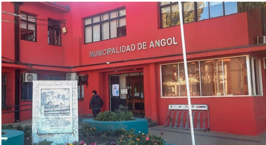
La auditoría financiera será a la Municipalidad y a los Departamento de Salud y Educación.

Cumplido ese plazo, la comisión evaluadora deberá hacer la apertura de las ofertas técnicas y económicas que se presentaron en el proceso y luego, días después, adjudicarla a la empresa que se hará cargo (se desconoce la fecha exacta). Luego, los resultados de la licitación son enviados a Contraloría para la toma de razón y recién después de aquello se debe concretar, entre otros