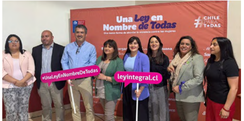
Las autoridades presentes en la actividad efectuada en Curacautín.

Durante la jornada se revisaron también avances legislativos y programáticos clave. Entre ellos, la Ley Integral 21.675