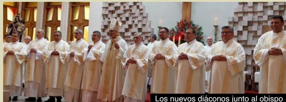
Los nuevos diáconos junto al obispo

Junto a los hermanos del Decanato de Angol, fueron ordenados hermanos de las Parroquias Jesús de la Misericordia de Labranza, San Juan Pablo II de Pillanlelbun, Sagrado Corazón de Jesús de Victoria y San Juan Bautista de Temuco.