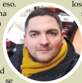
Por Francisco Roa Baeza

Un día le dije a mi hijo de 14 años te contaré la verdad con lo bueno y lo malo, pero te pido para que puedas decidir y opinar en el futuro, investiga lo que más puedas tú mismo. No permitas que en la U o en TV, profesores podridos o medios sesgados te vendan una versión que no es la real. Es imprescindible que las nuevas generaciones sepan de la historia completa y decidan por el bien de Chile, porque... Los jóvenes merecen saber para decidir.