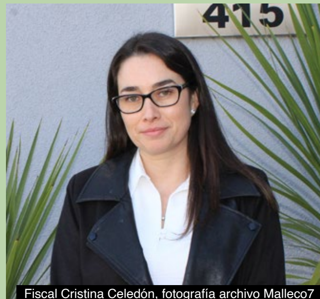
Fiscal Cristina Celedón

Sin embargo, indicó que el imputado mantiene irreprochable conducta anterior, por lo que solicitó la medida cautelar de arraigo nacional y la prohibición de acercarse a la víctima en su domicilio o en cualquier lugar en que esta se encuentre. El Tribunal otorgó un plazo de investigación de tres meses.