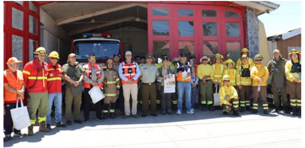
Foto masiva de la mayoría de las personas, de distintas instituciones, que participaron en la actividad preventiva.

hacer trabajos con maquinarias que pueden significar chispas y eso genere incendios".