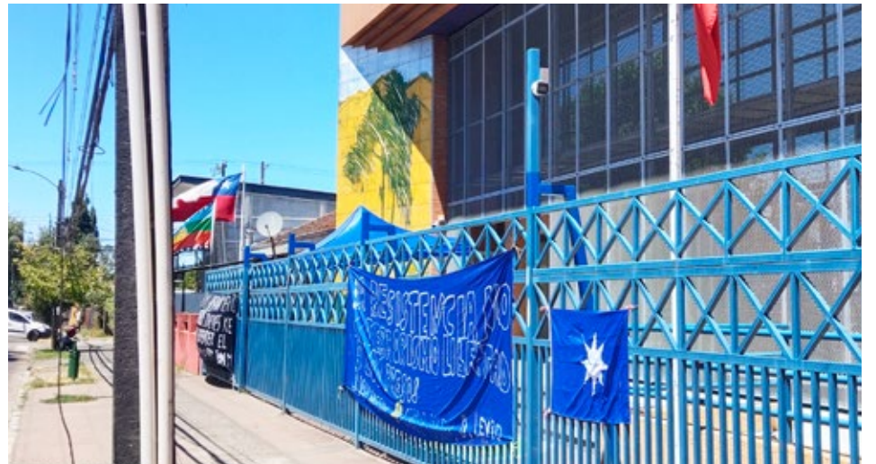
En el Tribunal de Juicio Oral se está realizando el juicio en contra de tres comuneros que están imputado del homicidio de dos personas en Collipulli.