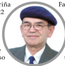
Por Miguel Angel Roa Rioseco

Es una pérdida para Angol pues ella por su gran labor cumplida, merecía una continuidad permanente, sobre todo que su Plan de Gestión para este año estaba aprobado por las autoridades comunales sin objeciones y además con el financiamiento debido.