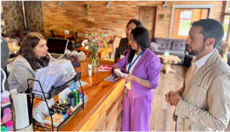
La campaña se inició el lunes en la comuna de Curacautín.

Dirección del Trabajo inició campaña regional