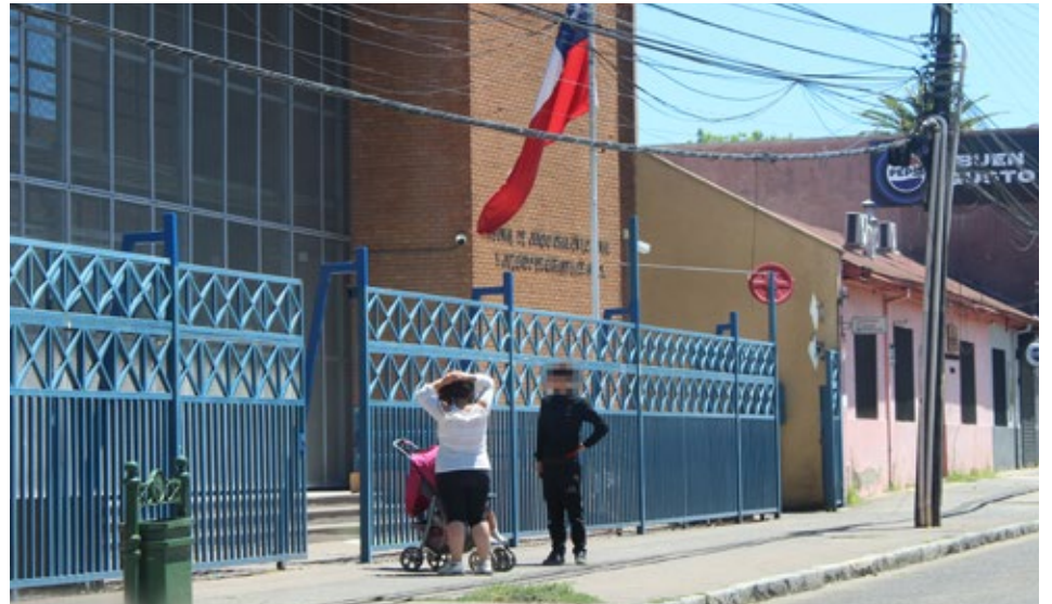
El Juzgado de Garantía de Angol decretó la medida cautelar de internación provisoria de un adolescente de 17 años, por su violento actuar.

adolescente "volvió a agredir a una funcionaria de Carabineros, logró zafarse e ingresó nuevamente al río, siendo finalmente detenido en el sector El Rosario".