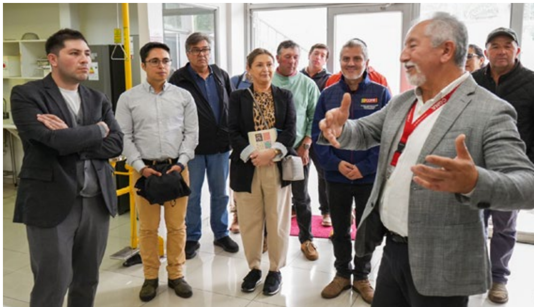
Lanzamiento del Programa “Araucanía Agroalimentaria” en dependencias del Centro de Genómica Nutricional Agroacuícola, CGNA.

La máxima autoridad detalló que, con este programa, “fortalecemos el ecosistema agroalimentario regional,