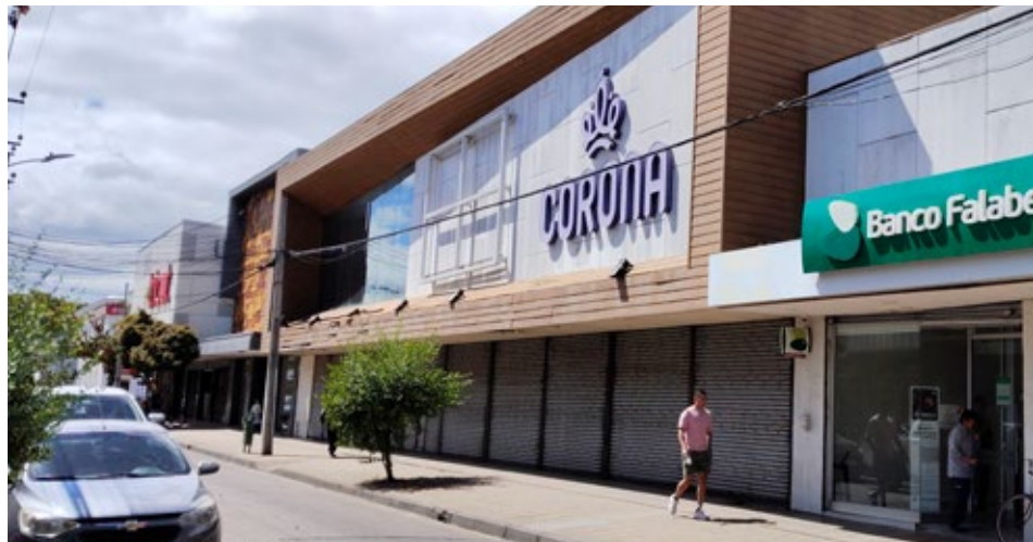
La tienda se ubicará en el local donde anteriormente estaba Corona, por calle Lautaro, junto a la sucursal del Banco Falabella.

La tienda integrará el acceso al catálogo digital completo de la empresa y ofrecerá servicios como Retiro en Tienda y cajas de autoservicio, orientados a mejorar la experiencia de compra de los clientes.