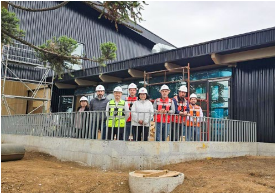
Las autoridades inspeccionaron la obra de la Escuela Salvador Allende, en Pailahueque, Ercilla.

Obra finalizará a mediados de año en Ercilla