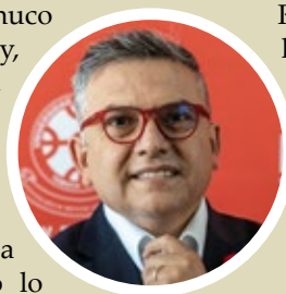
Por Marco Antonio Vásquez Ulloa, contador público y auditor e ingeniero comercial

Ya es tiempo de volver a levantar su Mercado. Y de volver a vivirlo.