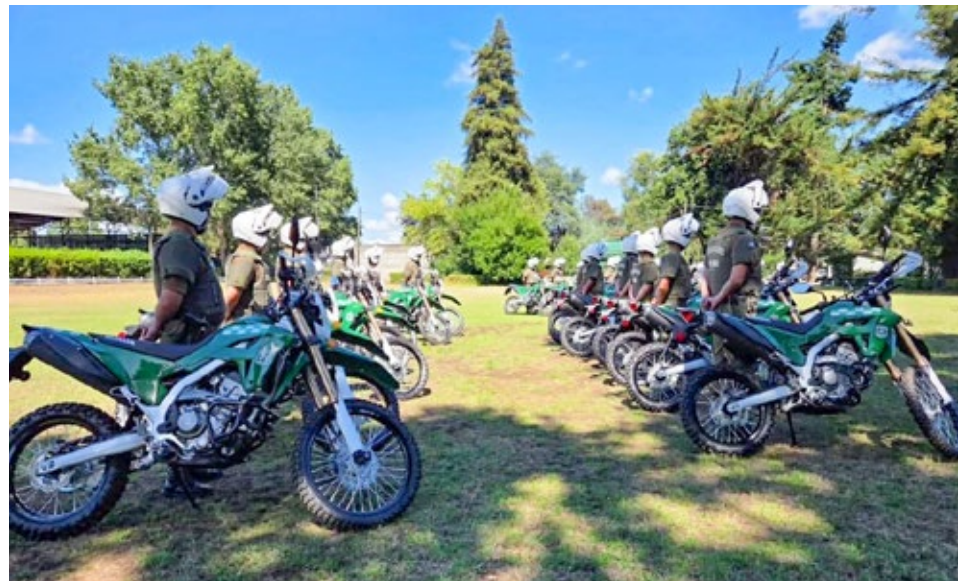
Un total de 31 motocicletas fueron entregadas para Carabineros en distintas comunas de La Araucanía.