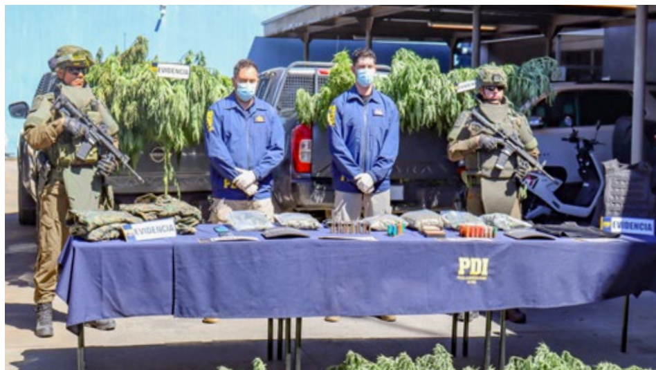
Todo lo incautado fue mostrado a la prensa ayer, en el cuartel central de la PDI, en Angol.

Aquí incautaron una pistola calibre 9 milímetros, que era un arma particular robada a un carabiniere el año 2018 en la comuna de Los Andes, 139 balas 9