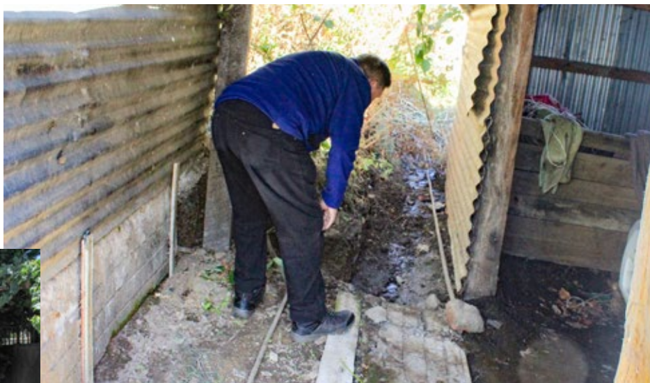
El escurrimiento de aguas servidas que atraviesa un patio y recorre la calle Valparaíso, en El Cañón, representa un significativo riesgo sanitario para al menos cinco familias.