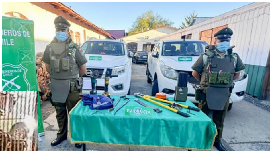
El registro audiovisual dejó en evidencia la decidida intervención del propietario y su hijo, cuyo accionar impidió la concreción del millonario robo.