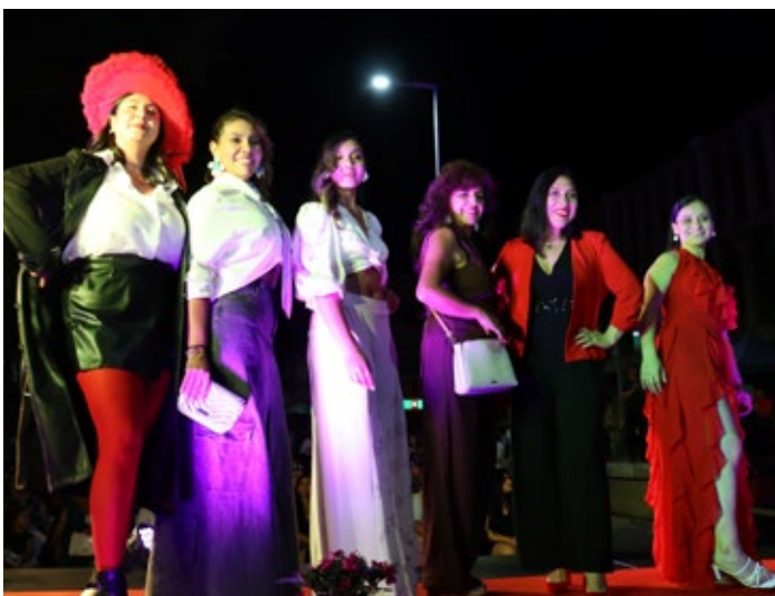
Las modelos de la boutique Gabantta.