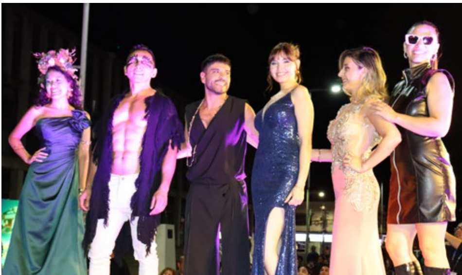
Las y los representantes de Sergio Estudio Peluquería.