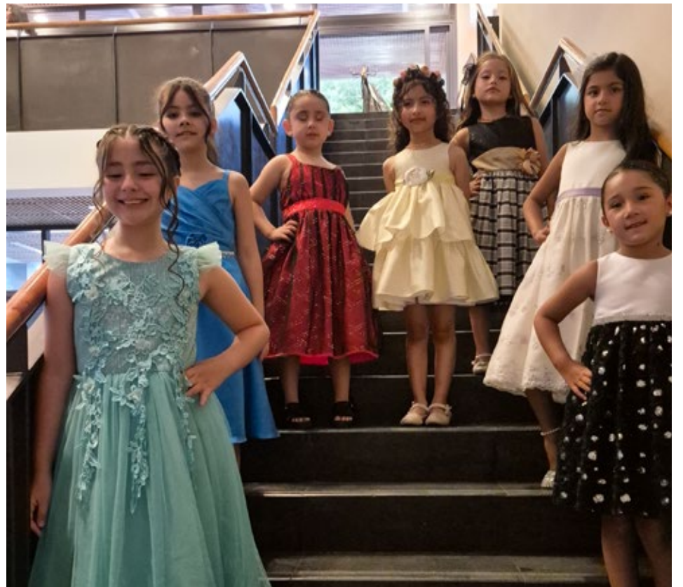
Desfilaron siete niñas en un momento de gracia y ternura.