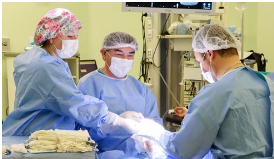
El Servicio de Salud Araucanía Norte logró resolver el 25% más antiguo de las listas de espera quirúrgicas.

Como las listas de espera son dinámicas y permanentemente siguen ingresando pacientes a las mismas, al resolver el 25% que más tiempo esperaba, se mejora