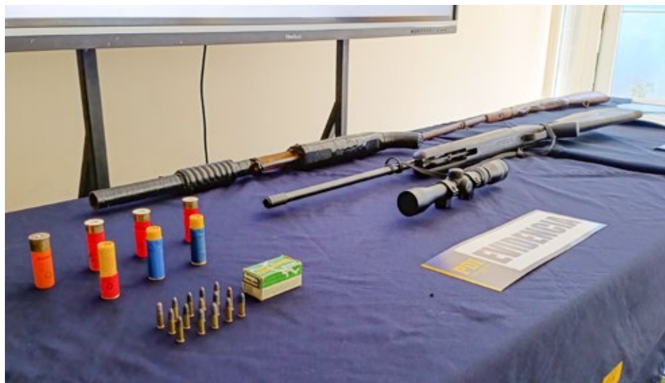
En el operativo policial, efectuado en el sector Huequén Alto, fueron incautadas armas y municiones.

El comisario también se refirió a las plantas de marihuana. “La droga incautada fue avaluada aproximadamente en 19 millones de pesos, que sería un equivalente cercano a las 19 mil dosis que habría sido destinadas para su comercialización”, puntualizó.