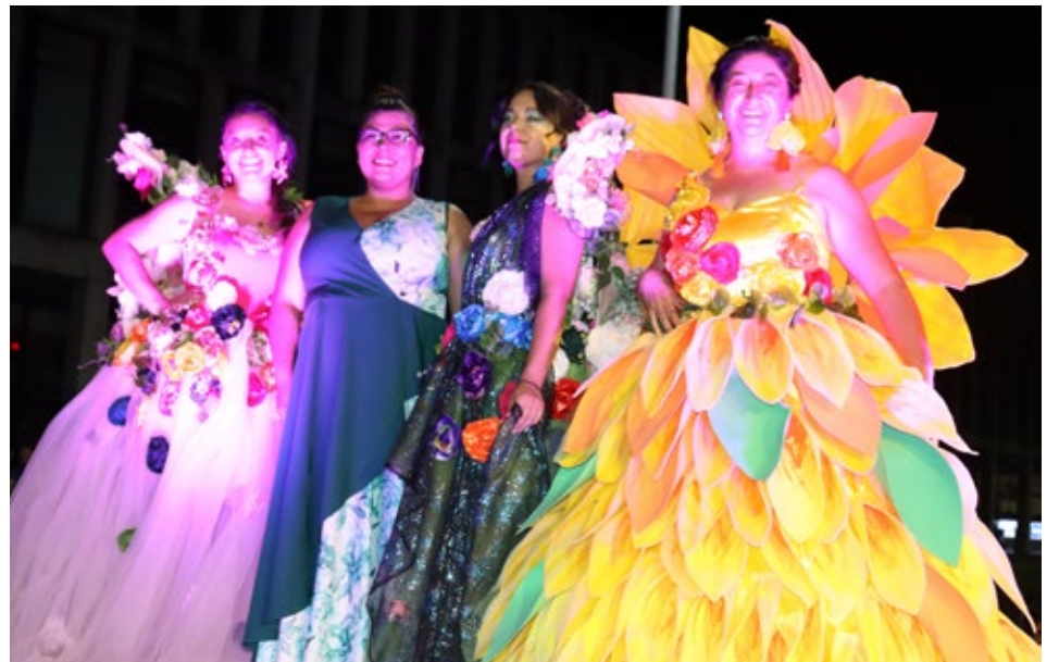
Las damas que modelaron los vestidos creados en el taller del Programa de la Mujer.