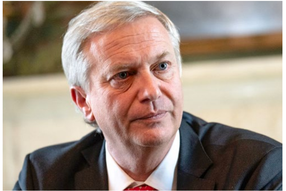
El Presidente electo José Antonio Kast será quien tendrá que definir en los próximos días a quien encabezara a su equipo en la Provincia de Malleco.

En las últimas semanas surgió, además, otra figura que ha ganado terreno en las conversaciones: el ex consejero regional