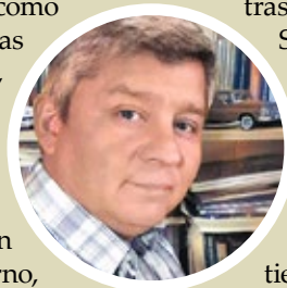
Por Luis Obreque Vivanco

Hace algunos meses, alguna prensa de tiraje nacional y medios en las redes, nos han bombardeado con noticias que, sin dejar de reconocer que enlodan a la Institución penitenciaria, Gendarmería de Chile, pretenden hacer aparecer a todos y todas los funcionarios como agentes corruptos, que no cumplen las obligaciones que les impone el servicio, sobre todo cuando el trabajo se hace al interior de los establecimientos penales, donde trabajan alrededor de 22.000 personas, uniformados y no uniformados, personas que a estas alturas deben preocuparse del orden y régimen interno, propio de sus funciones, con el cuidado de aquellos que han torcido