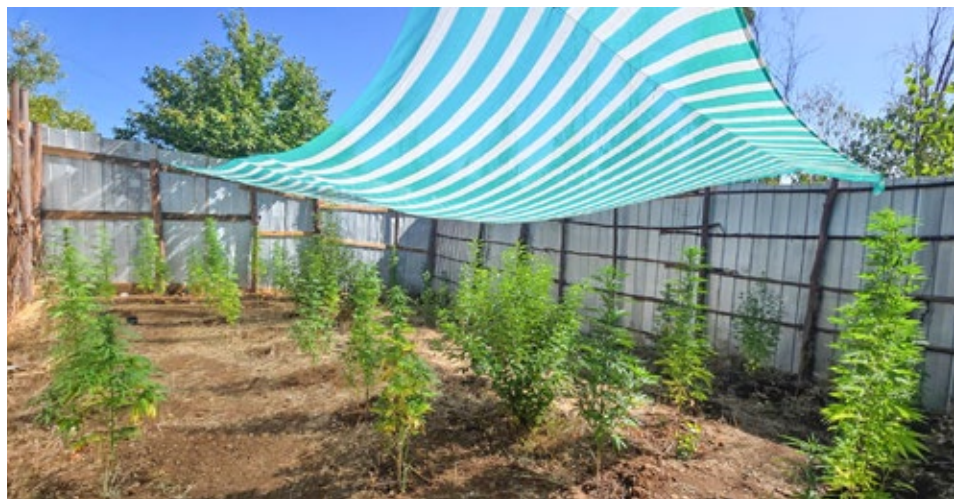
También fueron decomisas 38 plantas de marihuana en proceso de crecimiento.