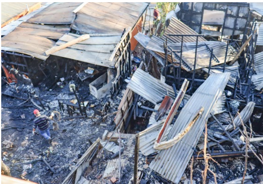
El panorama era desalador ayer en la mañana en la Villa Los Andes, donde el fuego arrasó dos viviendas.