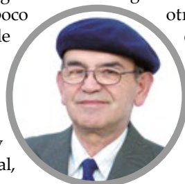
Por Miguel Angel Roa Rioseco

Por el bien de la paz mundial y por el respeto a la vida, pensemos como humanidad en los niños más pequeños del mundo, no importa de qué continente ni color. Pensemos y roguemos por las mujeres madres y todas las mujeres del mundo, por los jóvenes que aun sueñan con una humanidad para todos y también por quienes estamos en el ocaso de la existencia, aunque Trump no piense en ninguno de ellos y ordene más guerras.