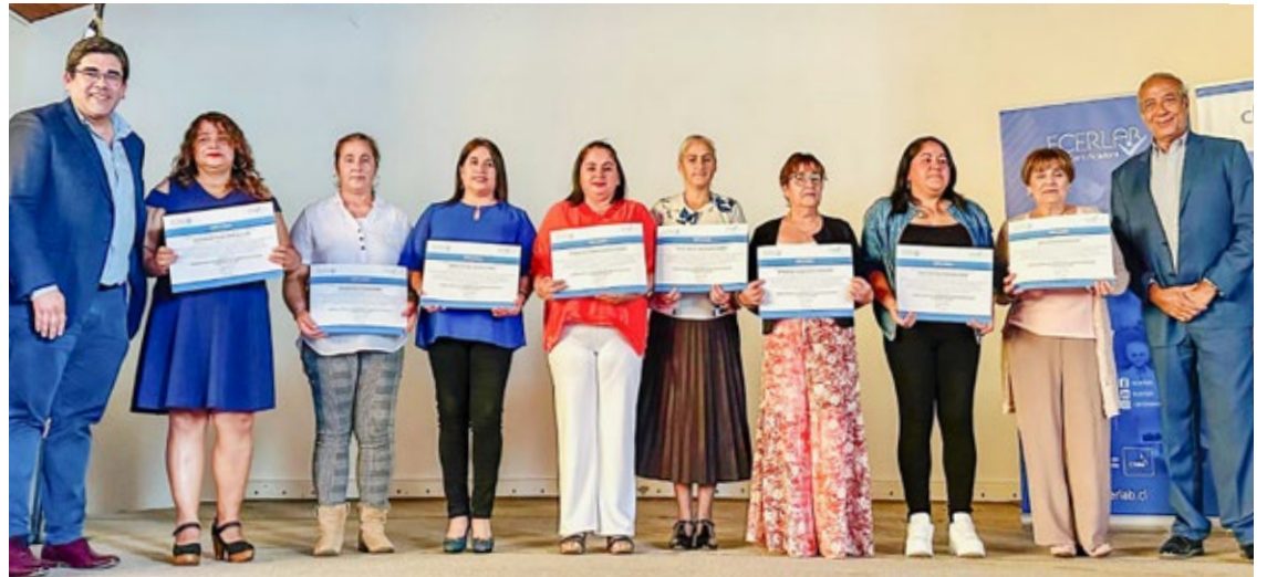
En la ceremonia, efectuada en la comuna de Victoria, fueron certificadas 53 manipuladoras de alimentos.

Las evaluaciones fueron realizadas por el Centro de Evaluación de Competencias Laborales, Ecerlab, y se desarrollaron directamente en los establecimientos educacionales, en coordinación con Junaeb y la empresa concesionaria del servicio de alimentación escolar a la que pertenecen las trabajadoras, Empresa de Servicios de Alimentos Soser.