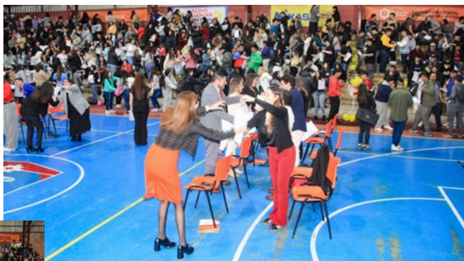
Más de 500 nuevos alumnos, pertenecientes a 10 carreras, fueron recibidos el lunes en el CFT de la Región de La Araucanía.

jornada diurna se retiraron a sus hogares, mientras que los alumnos vespertinos realizaron el proceso de reconocimiento de salas y participaron en la inducción relacionada con sus procesos académicos. Una actividad de características similares se llevó a cabo el martes en la sede Lautaro.