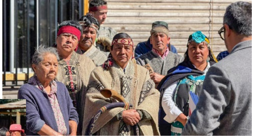
En la significativa ceremonia participaron miembros de la comunidad Manuel Chavol y autoridades.

personas, de los dirigentes, que hicieron que esto se concretara, porque hubo personas que nunca dejaron de soñar", indicó.