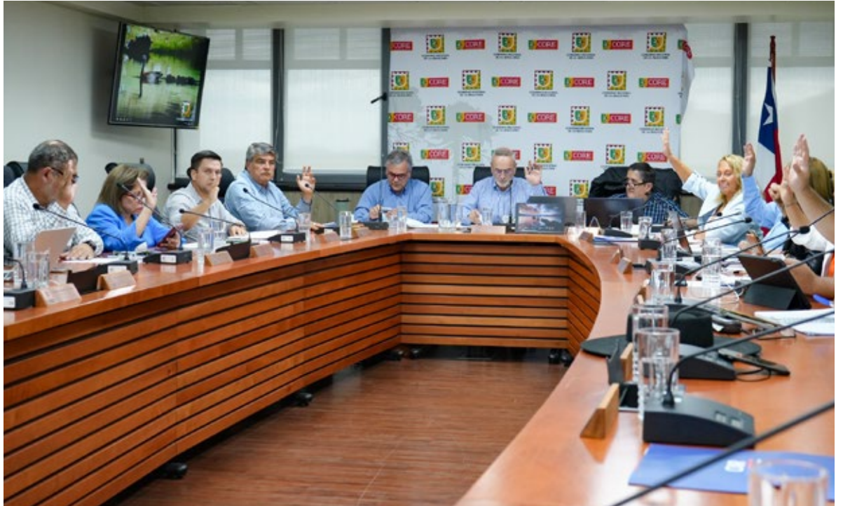
La iniciativa fue aprobada por el Consejo Regional, Core, de La Araucanía.

El programa tiene como meta beneficiar de forma directa a 1.034 mujeres de las 32 comunas de la región, mediante subsidios directos para inversión y fortalecimiento de la competitividad y participación en programas de transferencia de competencias, formación empresarial