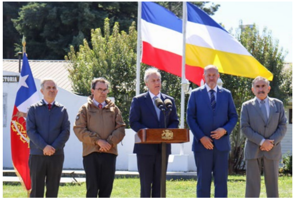
En el Regimiento de Victoria, el Presidente José Antonio Kast, acompañado de varias autoridades, efectuó una declaración a la prensa.

A su llegada Kast saludó a personal militar del Regimiento y luego caminó a la reja del frontis del mismo, donde saludó y habló con personas que llegaron a apoyarlo, las que superaban las 100.