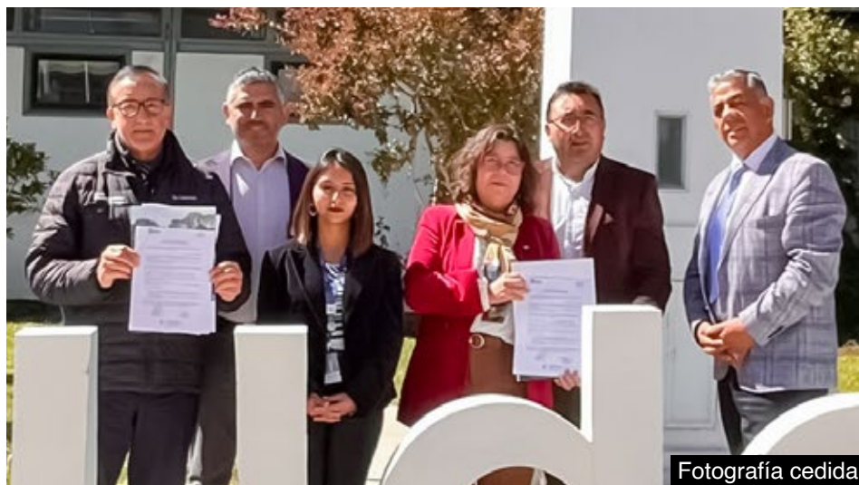
Las autoridades académicas y edilicias se reunieron en la sede del campus Los Ángeles de la Universidad de Concepción.

Durante la jornada se expusieron los fundamentos y alcances de esta alianza, destacando su enfoque en la generación de iniciativas orientadas a la innovación, la transferencia tecnológica y el