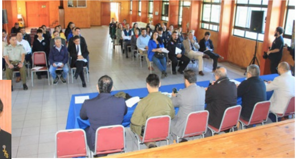
La reunión, en que participaron diversas autoridades, se realizó en el auditorio del Liceo Comercial Armando Bravo de Angol.

La implementación de estos acuerdos se proyecta como un paso fundamental para mejorar la convivencia escolar en la comuna, avanzando hacia entornos educativos más seguros, organizados y protectores, donde la prevención y el