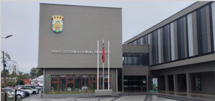
El Aporte Estudiantil se realiza con recursos municipales.

El Aporte Municipal para Estudiantes de Educación Superior de Angol es una ayuda económica directa aprobada por el Concejo Municipal para alumnos de la comuna que cursan carreras técnicas o universitarias, que buscan en la medida de lo posible fomentar la continuidad de estudios y reducir gastos de mantención.