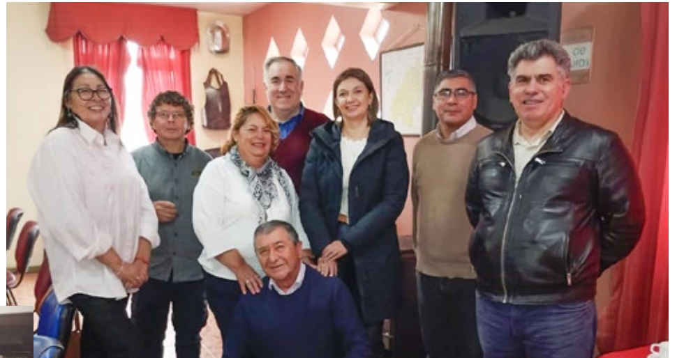
La XXIII Asamblea Provincial de la Federación de Uniones Comunales de Juntas de Vecinos de Malleco se efectuó en la comuna de Lumaco.

También se abordaron otras temáticas, una de ellas referidas a la salud en la provincia de Malleco, especialmente por la lentitud que dirigentes vecinales aprecian en la atención de determinadas patologías