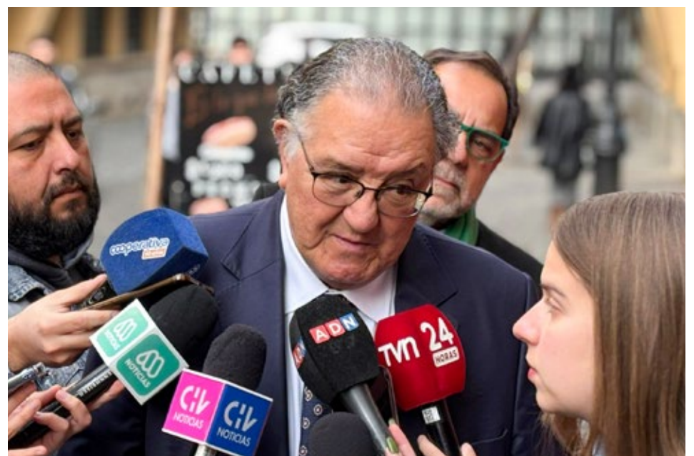
El senador por la región de La Araucanía, Francisco Huenchumilla Jaramillo.

Por otra parte, el senador apuntó a la necesidad de “esclarecer las responsabilidades administrativas que puedan existir en el hecho que, en un proceso de cobro judicial, se decretó el