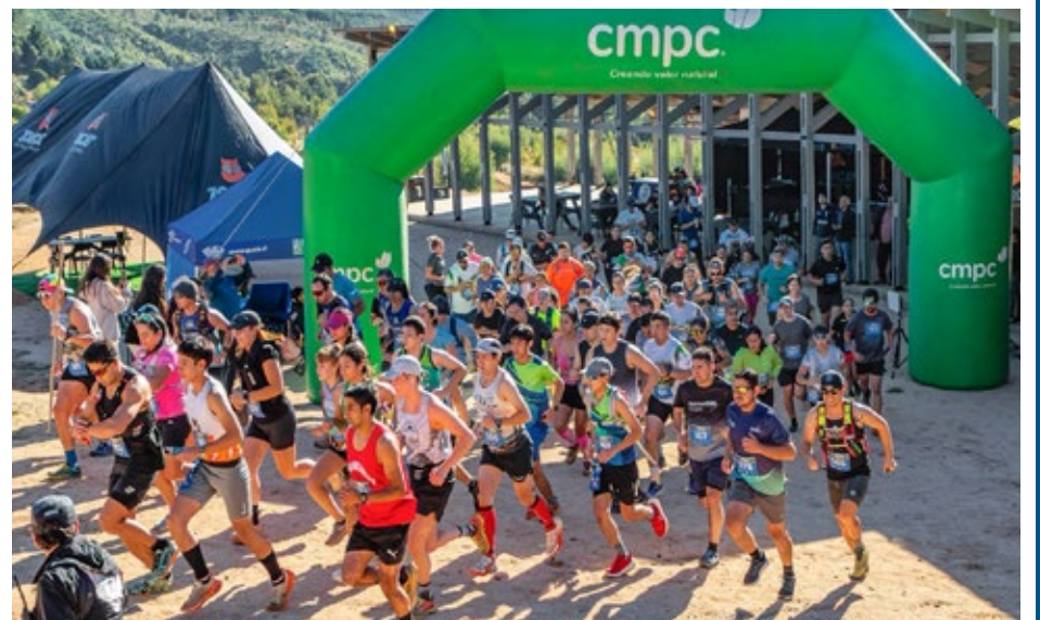
En la actividad, realizada el Parque CMPC Junquillar, participaron 138 deportistas.

física, sino que también fortalecen el vínculo con el territorio y las comunidades, posicionando a Angol como un lugar privilegiado para el desarrollo del trail running en el sur de Chile”, señaló Gustavo Apablaza, subgerente de relacionamiento de CMPC.