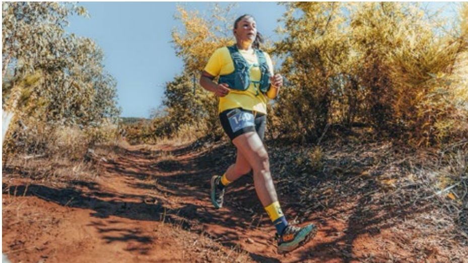
La competencia deportiva contempló dos distancias, de 7 y 14 K.