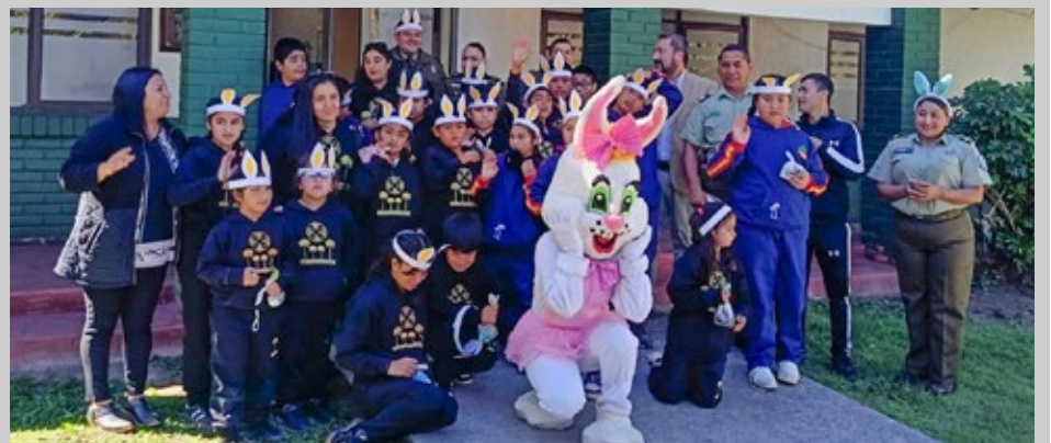
La actividad se efectuó el martes en la Primera Comisaría de Angol.

La alegría de las niñas con sus chocolates en la unidad policial.