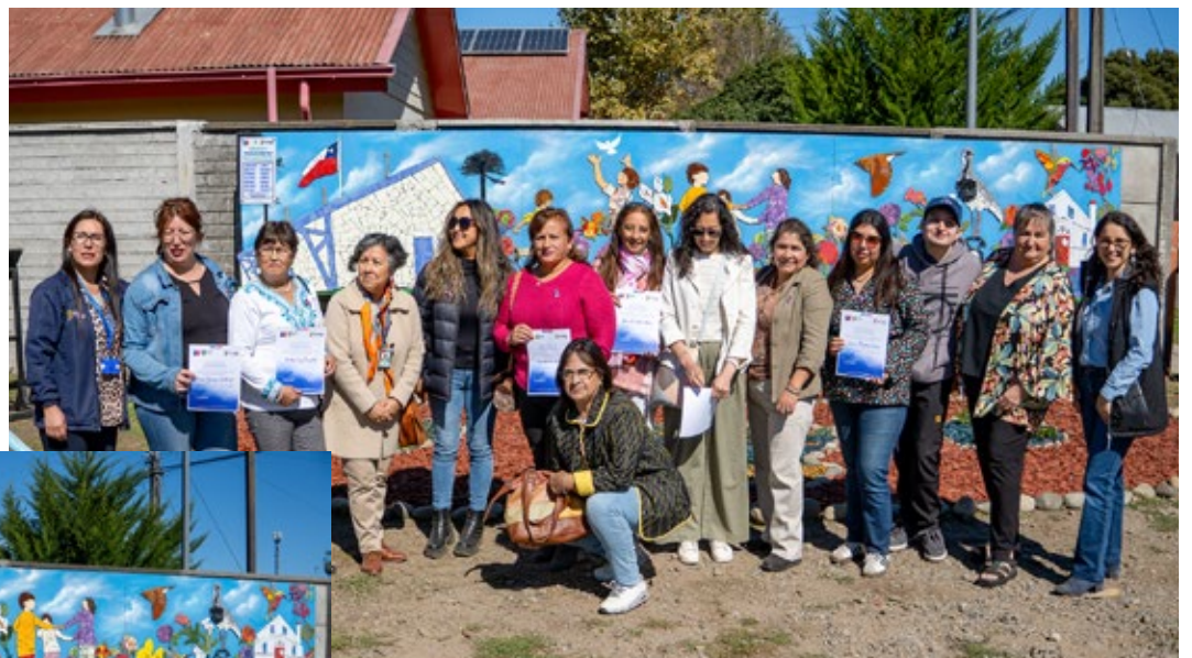
Vecinos y funcionarios de Quiero Mi Barrio en la inauguración del mural.