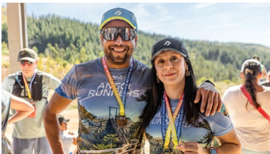
Fue un encuentro de deporte, alegría y vida sana en la comuna de Angol.

Este tipo de instancias forman parte del compromiso de Bosque Vivo CMPC por promover el deporte al aire libre, la vida saludable y el uso responsable de los espacios naturales, contribuyendo además al posicionamiento de Angol como un destino relevante para el desarrollo del trail running en Chile.