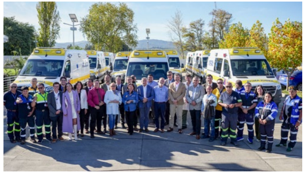
Al final de la ceremonia las autoridades y los conductores se tomaron una fotografía con las nuevas ambulancias.

Aquí las autoridades entregaron cuatro ambulancias, una a cada uno, a los hospitales de Curacautín, Lonquimay, Collipulli y Purén; dos para el de Victoria; dos para el de Traiguén; y tres para el de