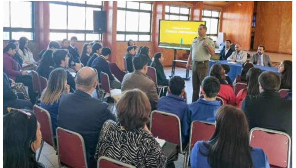
El conversatorio se efectuó en el auditorio del Liceo Comercial Armando Bravo Bravo, de Angol.