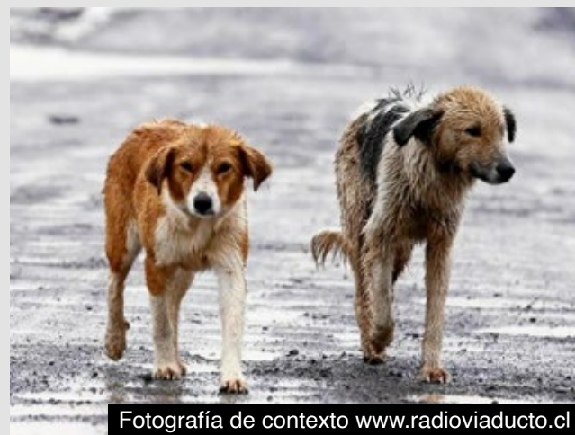
Fotografía de contexto www.radioviaducto.cl

Entre los efectos más visibles se encuentran la proliferación descontrolada, la exposición de los animales a enfermedades y la