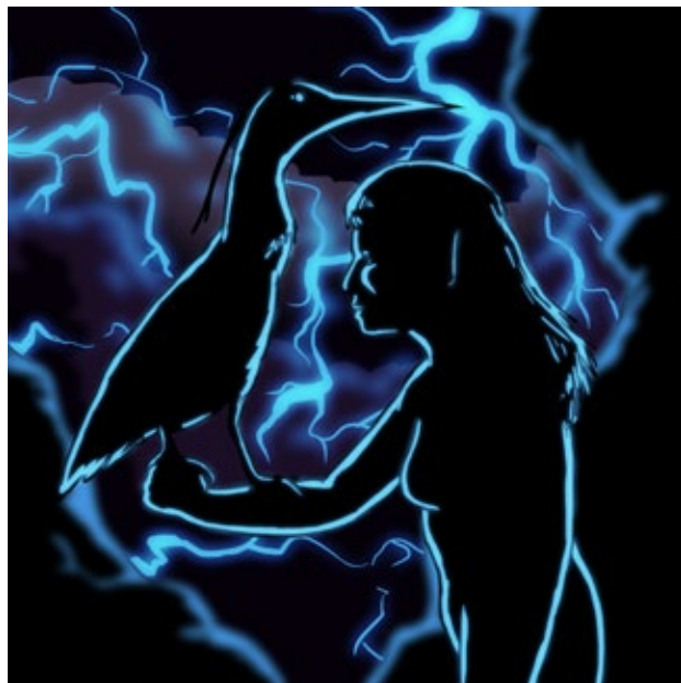
La portada del single "Estática".