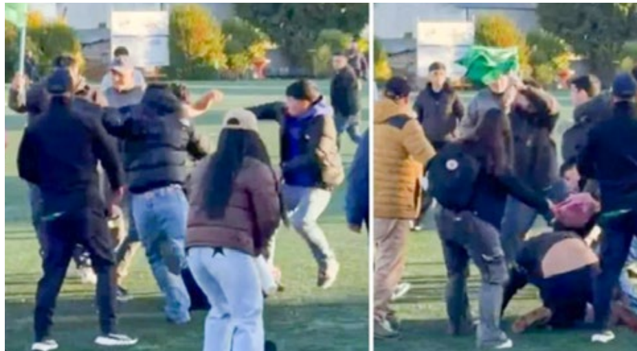
Captura de pantalla de registro audiovisual de los violentos hechos ocurridos en la cancha del estadio de Nueva Imperial.

de disciplina analizara y tomara decisiones.