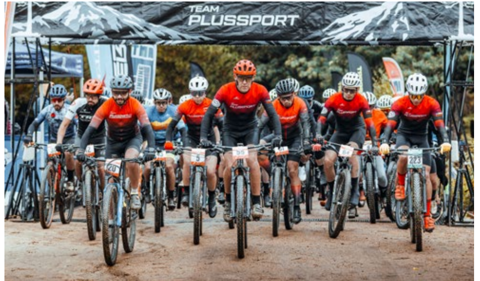
La actividad se realizó el sábado pasado en el Parque CMPC Pumalal de Temuco.

Esta edición incorporó premiación hasta el quinto lugar en cada categoría,