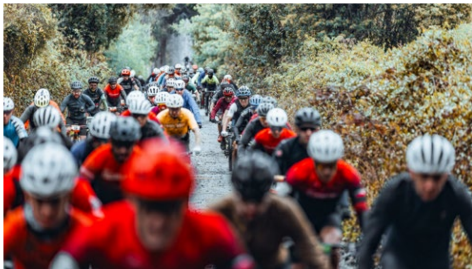
En las categorías competitivas participaron alrededor de 160 deportistas.

Más información en: www.bosquevivocmpc.com