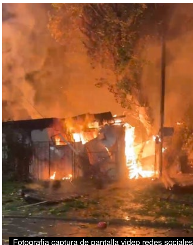
Fotografía captura de pantalla video redes sociales

Carabineros estableció que la estructura quemada en Los Lagos, presuntamente ocupada por personas en situación de calle, estaba deshabitada al momento del inicio del fuego.