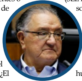
Por Francisco Huenchumilla Jaramillo, Senador

Por eso, la visión sobre una Economía Social y Ecológica de Mercado –sí, subrayamos lo de ecológica– es el modelo de desarrollo que defenderemos siempre.