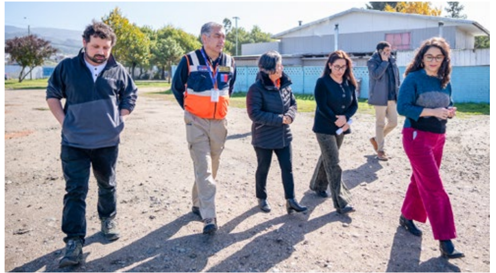
La actividad se realizó en la población Javiera Carrera.

Compañía del Cuerpo de Bomberos de Angol recalzó la necesidad de mantener despejado el acceso para vehículos de emergencia en pasajes y calles de Javiera Carrera, además de evitar estacionar vehículos frente a grifos, facilitando así una respuesta rápida en caso de incendios. Este trabajo forma parte del Plan de