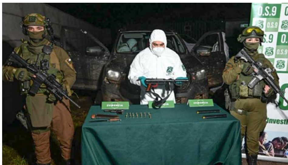
Carabineros incautó armas, municiones y un vehículo presuntamente vinculado a los hechos investigados por la Fiscalía.

Desde Carabineros se indicó que, tras los ataques, se dispuso de manera inmediata la conformación de un equipo multidisciplinario integral con el objetivo de identificar y ubicar a los responsables de los