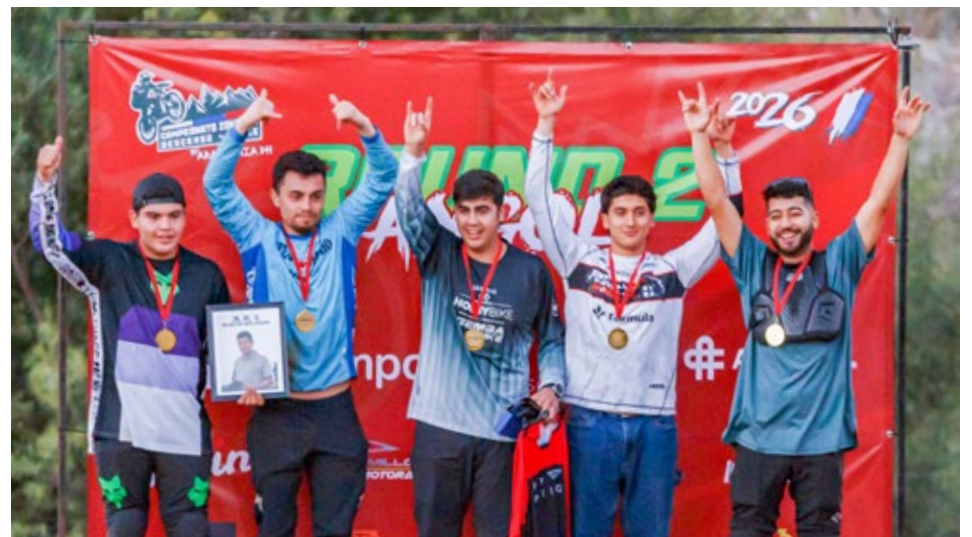
Se premió a los ganadores en las distintas categorías.

La actividad se efectuó con gran participación en el Parque CMPC Junquillar, en Angol.