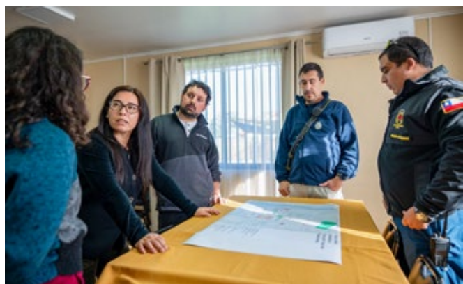
Se trabajó en el marco del Plan de Reducción de Riesgos de Desastres del Barrio Javiera Carrera.