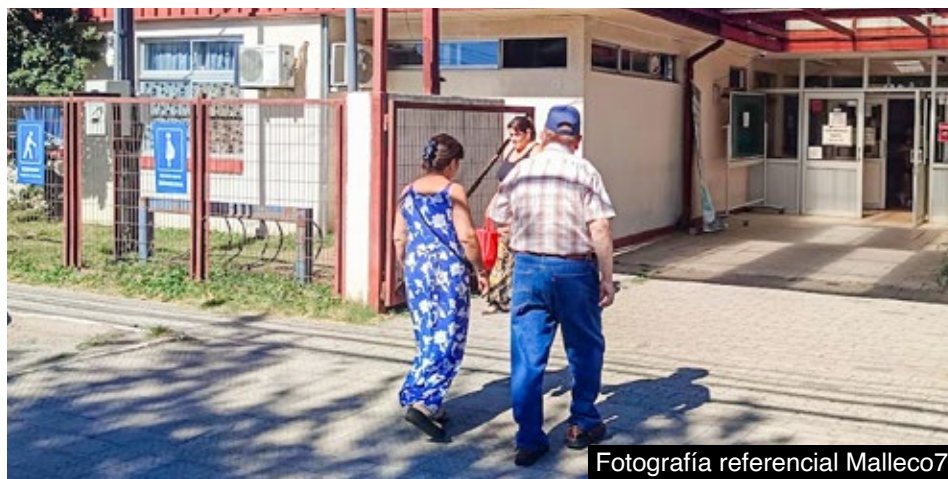
Fotografía referencial Malleco7

La familia anunció que continuará exigiendo explicaciones respecto a los protocolos aplicados y la identificación