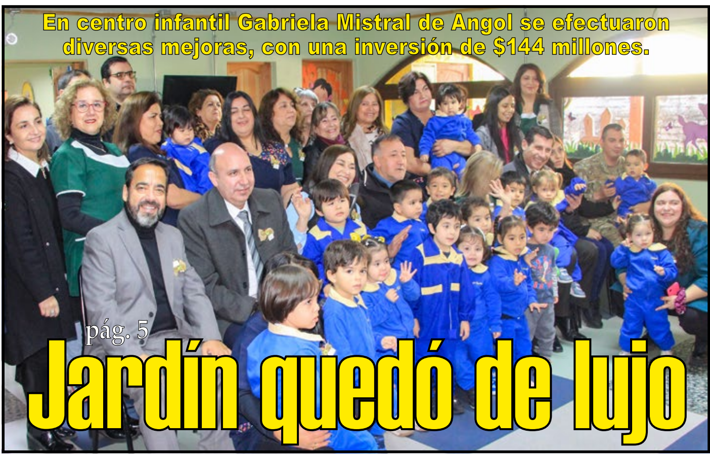
En centro infantil Gabriela Mistral de Angol se efectuaron diversas mejoras, con una inversión de $144 millones.

12 En Imperial persona murió atropellada cuando sujetos intentaron parar camión.