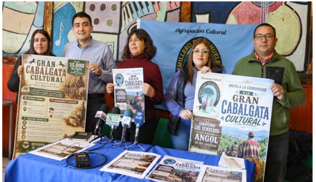
La invitación a la "Gran Cabalgata Cultural" fue efectuada el martes en una conferencia de prensa.

Esta actividad, que también será para ayudar a dos familias de la Agrupación organizadora que están pasando difíciles momentos, tendrá una inscripción de $15.000 por persona que acudirá con su cabalgadura, lo que incluirá la participación en la cabalgata,