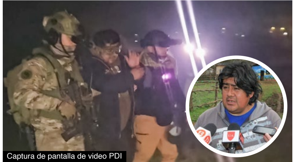
Captura de pantalla de video PDI

Añadió que incluso las coordinaciones se realizaron fuera de las dependencias policiales y con un círculo muy acotado de funcionarios. “Todo el proceso se fue construyendo mediante reuniones con Carabineros y fuera de los cuarteles, lo que permitió avanzar hasta establecer la ubicación de esta persona y