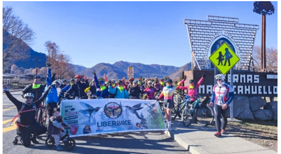
Los ciclistas recorrieron una de las ciclovías más hermosas de Chile, la ruta Malalcahuello – Manzanar, en la precordillera andina de La Araucanía.

Fue una jornada de alegría, deporte y compañerismo la que vivieron los miembros de Liberbike Angol.