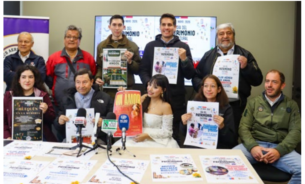
Los participantes en la conferencia de prensa efectuada en la Municipalidad de Angol, en la cual se invitó a las diversas actividades por el Día del Patrimonio Cultural.

El sábado el Club Aéreo de Angol, entre 9 y 14 horas, efectuará una exposición que incluirá exhibición de material audiovisual respecto de hechos históricos y de importantes labores que realiza esta institución, que cumplió 82 años; la exhibición de sus aeronaves e incluso se desatpará el motor de una de ellas para que la gente conozca su funcionamiento. El vicepresidente del