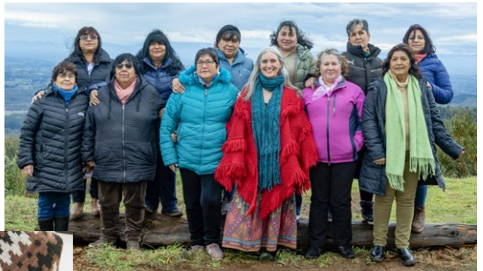
Lanzamiento de Colección de Tejidos Primeros Pueblos.

“Cuando les mostramos lo que queríamos hacer, muchas pensaron que era imposible. Empezamos tejiendo una muestra, después un cuello y luego un sweater, hasta que entendieron que sí podían lograrlo. Ha sido muy