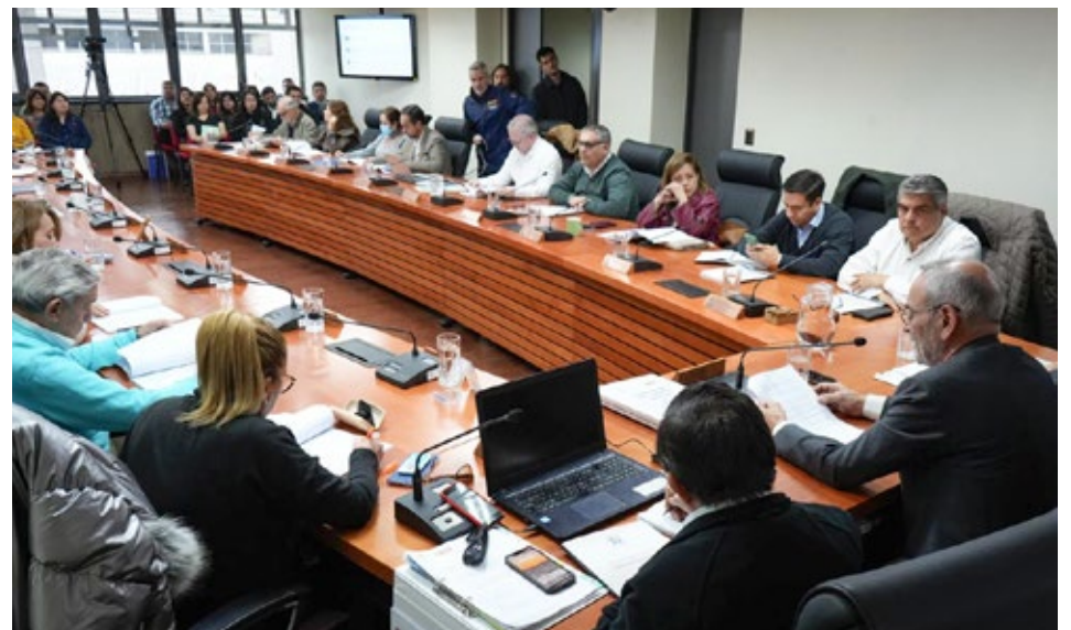
El gobernador de La Araucanía, René Saffirio, efectuó ayer su Cuenta Pública 2025 ante el Consejo Regional, Core.

En el marco de la Estrategia Regional de