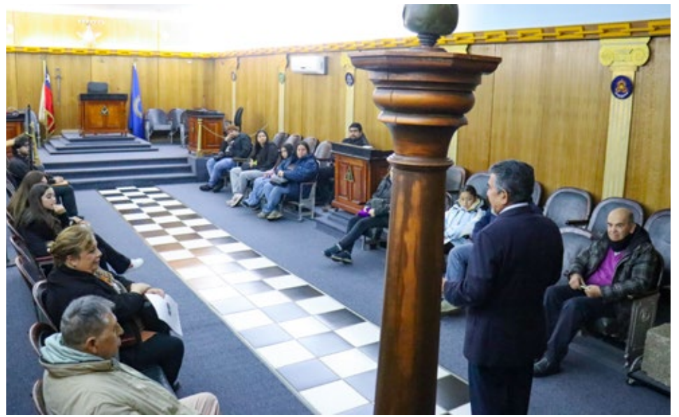
La Logia Masónica Patria Chilena N° 55 de Angol abrió sus puertas el domingo, para dar a conocer su aporte al desarrollo histórico de la ciudad y de la masonería en distintos ámbitos, como a la educación chilena. Hubo una exposición de su biblioteca y de fotografías antiguas y la gente pudo ingresar a su templo, donde se dio a conocer su esencia, centrada en el crecimiento de la persona.

Diversas actividades hubo por Día del Patrimonio Cultural; a continuación algunas de ellas