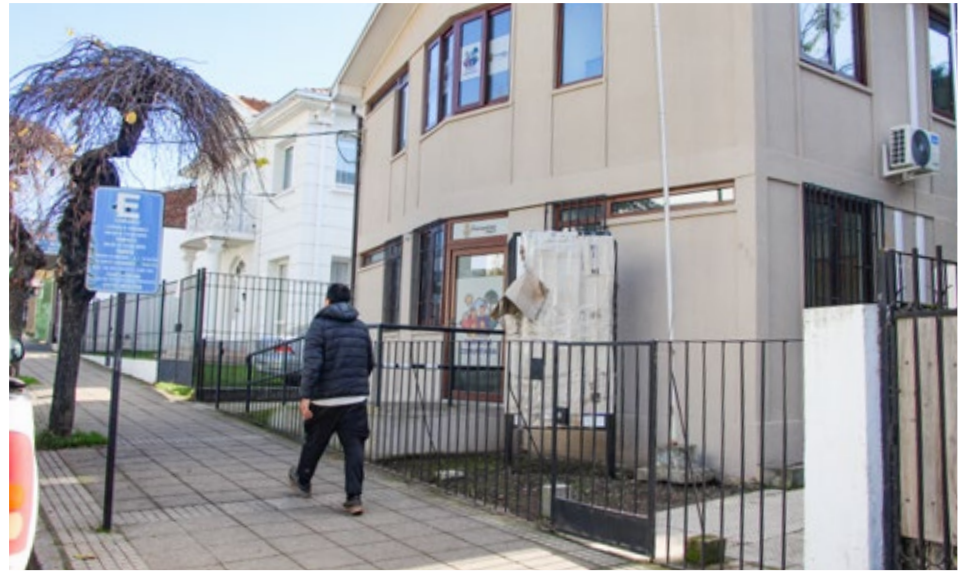
La Farmacia Comunitaria funcionará en el inmueble que durante años ocupó el Cantón de Reclutamiento, frente al edificio del CFT Estatal de La Araucanía.