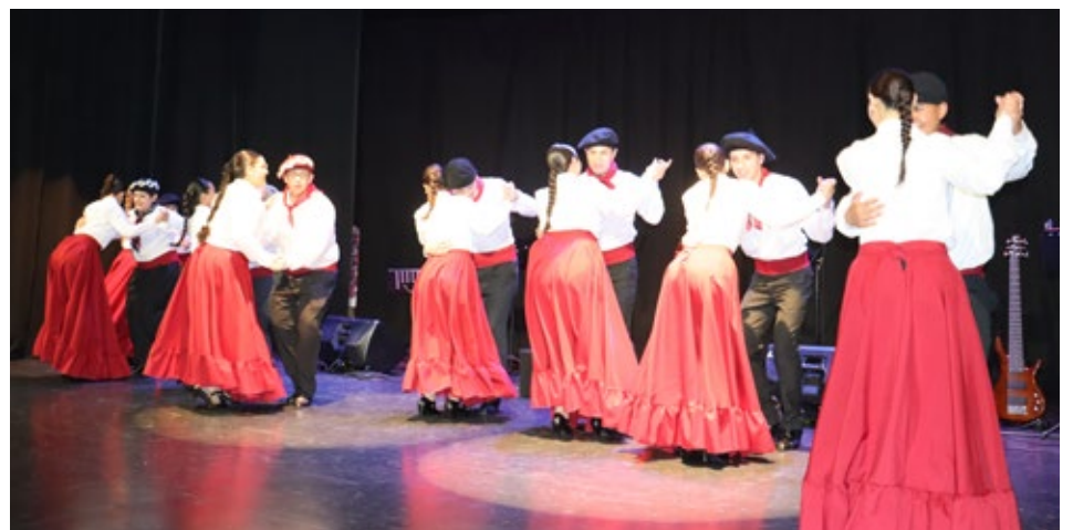
El sábado en el Centro Cultural actuó el Club de Cueca Los Confines de Angol, que tiene 52 años de historia, incluyendo su Semillero y conjunto folclórico.