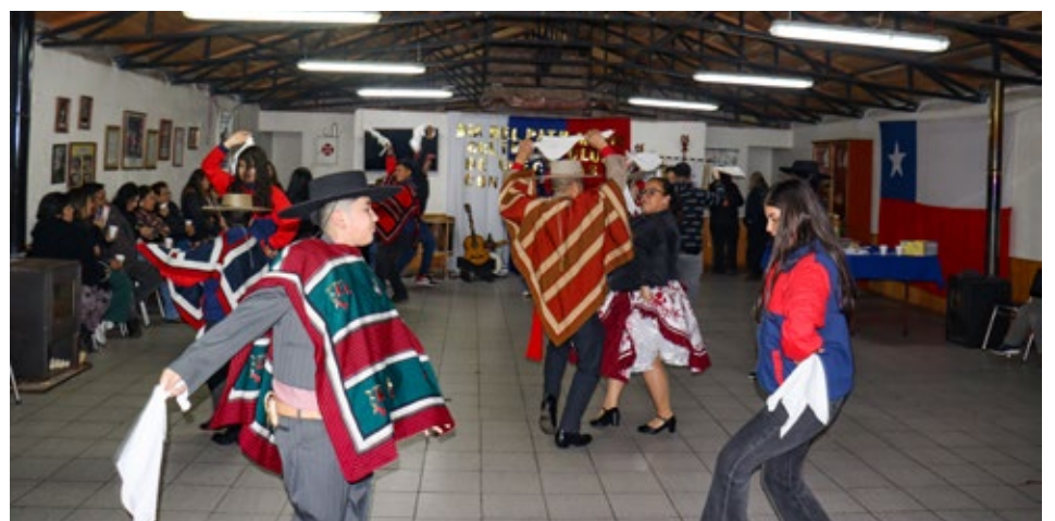
Las actividades culminaron el domingo, con una Cuecada que efectuó en su sede el Club de Cueca Los Confines de Angol.