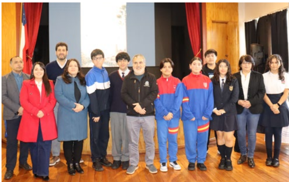
En el Campus Angol de la Ufro se efectuó la premiación del Concurso literario "Angol en 200 palabras", organizado por esta Universidad, la Cámara de Turismo de Malleco, CMPC, el Departamento de Turismo de la Municipalidad y la Oficina Local de la Niñez.