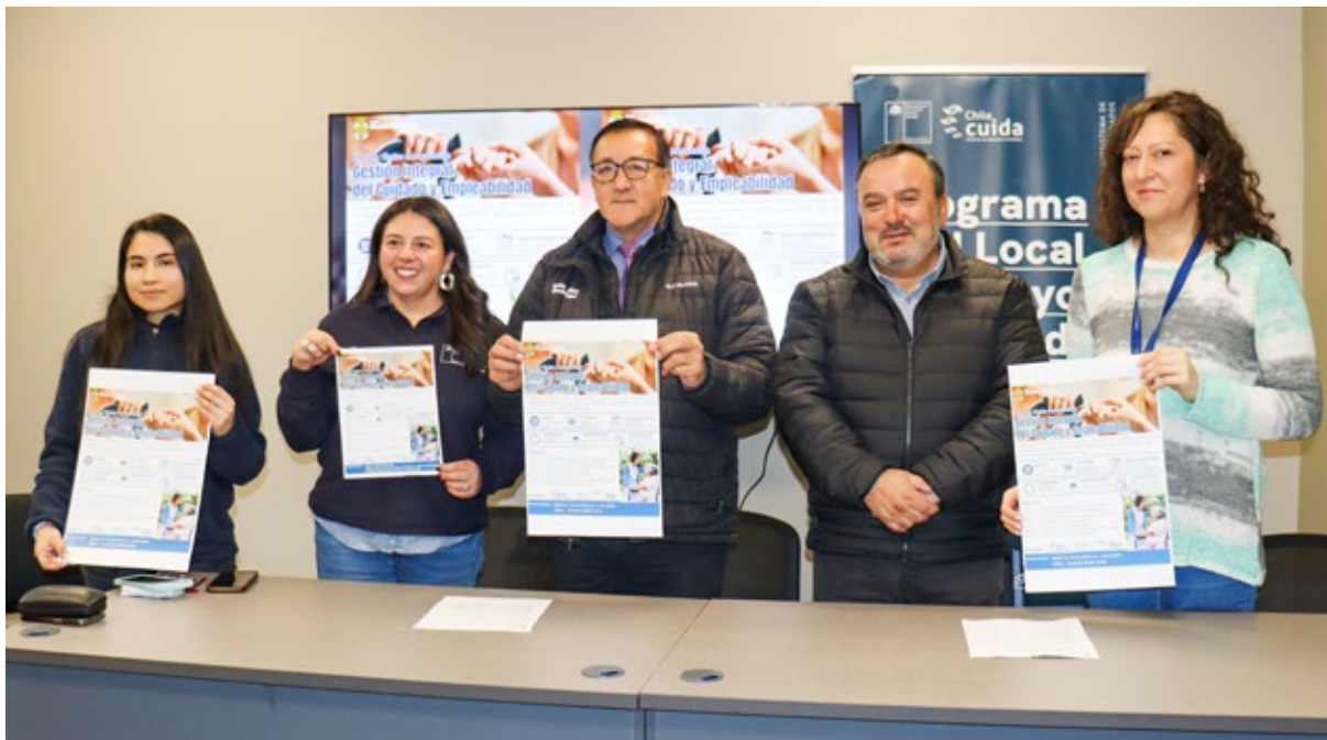
Las personas que participaron en la conferencia de prensa dada ayer para informar del programa de capacitación.

En esta capacitación -agregó Coello- los conocimientos de funcionalidad, movilidad y ergonomía serán entregados por un kinesiólogo; autonomía y adaptación del entorno, por terapeuta ocupacional; salud mental, autocuidado y prevención de sobrecarga, por un psicólogo; también habrá un módulo de introducción a la Ley Chile Cuida, y otro con la oferta programática en Angol, porque las cuidadoras no sólo tienen que atender a la persona en dependencia en sus necesidades diarias, sino que en algún momento tendrán que orientar a su familia; y un módulo fundamental