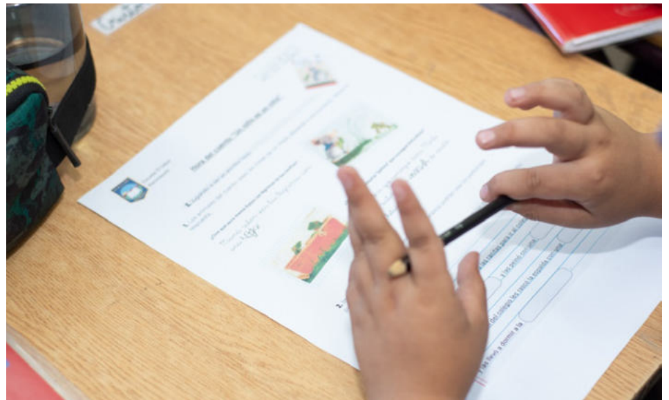
El trabajo con los niños se efectúa gracias al convenio existente entre AraucaníAprende y Fundación CMPC.

Para Fundación AraucaníAprende extender su alianza colaborativa con Fundación CMPC implica un nuevo desafío, pues si bien el programa PIE lleva años de implementación, es la primera vez que el equipo apoya y guía el aprendizaje lector de niños con necesidades educativas permanentes; lo que ha llevado a la coordinación del programa a diversificar las acciones y consensuar estrategias de