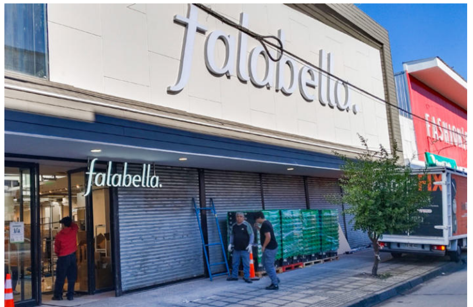
La sucursal de Falabella abrirá este viernes en Angol.

El establecimiento -cuya inauguración oficial se programó para la semana del 20 de julio- atenderá de lunes a domingo, incluidos festivos. El horario será continuado, entre las 09:30 y las 19:30 horas de lunes a sábado; los domingos atenderá de 10 a 19 horas.