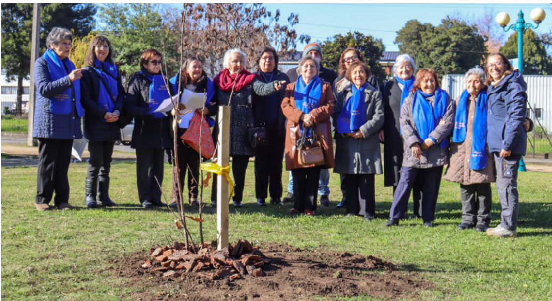
Las profesoras normalistas al final entonaron el himno de la Escuela Normal de Angol.

Agregó que al árbol le dispusieron materia orgánica, protección de corteza y fue encargado a la empresa de mantenimiento de áreas verdes para que lo riegue.