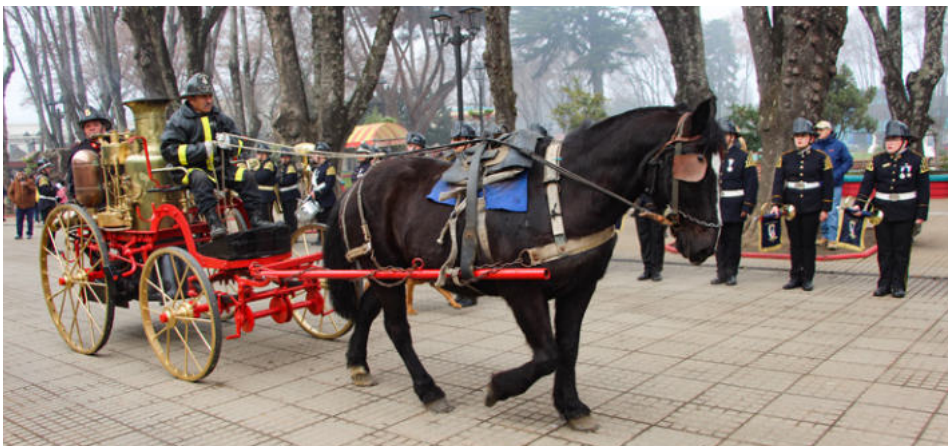
Frente a las autoridades pasó un carro a vapor tirado por un caballo. Es de origen inglés y prestó servicio en Angol hasta que llegó el primer carrobomba a la ciudad.

La conmemoración concluyó con una formación de honor frente al Cuartel General del Cuerpo de Bomberos de Angol, poniendo término a una jornada de reconocimiento a los 175 años de historia, entrega y servicio de Bomberos de Chile.