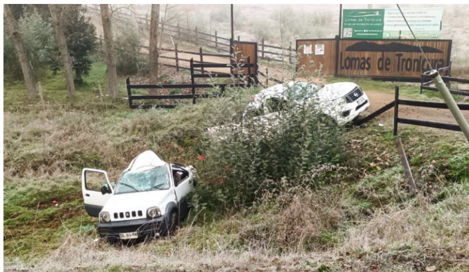
Los vehículos que se salieron de la Ruta R-86, ayer en la mañana, donde falleció un vecino fue a prestar ayuda a los ocupantes de uno de los móviles.

Fue en esta curva donde el conductor de un vehículo Suzuki Jimny, que se dirigía de norte a sur, en dirección a Los Sauces, perdió el control del mismo y terminó cayendo a algunos metros al costado oriente de la ruta; en este sector había un vecino al interior de un vehículo estacionado en el acceso al sector habitacional mencionado, quien al ver lo ocurrido se bajó y fue a prestar ayuda a las personas que iban en el vehículo accidentado; fue en ese momento cuando, lamentablemente, el conductor de una camioneta Nissan, en la misma curva y dirección sur, perdió el control de este vehículo y se salió igual al oriente de la vía, donde impactó al