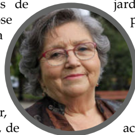
Por Misaela Figueroa Melo

Finalmente, es menester tener presente que "no solo de pan vive el Hombre".