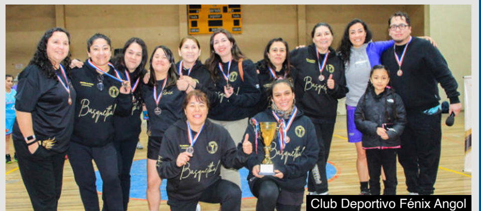
Club Deportivo Fénix Angol

Torneo de invierno reunió a 40 deportistas